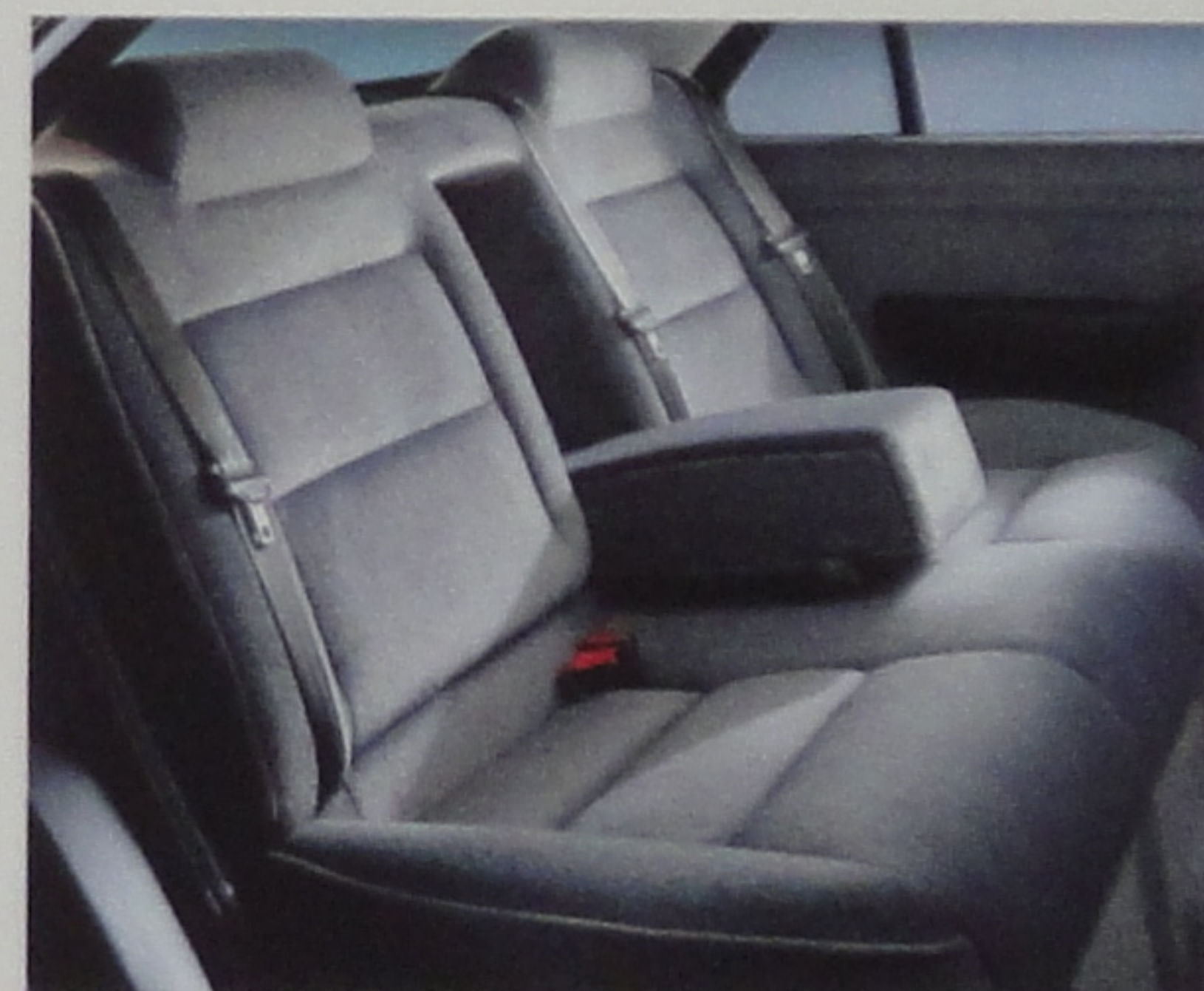
Accoudoir arrière avec trappe à skis.