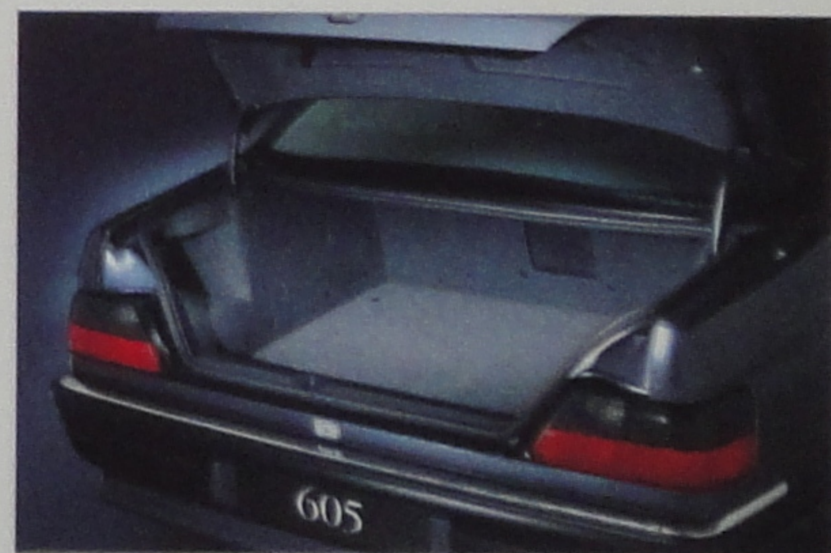
Vérins d'assistance d'ouverture du coffre.