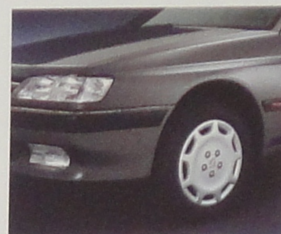
Peinture métallisée en option.

• Equipements de base. Outre la garantie légale toutes les Peugeot bénéficient d'une garantie d'un an pièces et main-d'œuvre sans limitation de kilométrage. Automobiles Peugeot se réserve le droit de modifier, sans préavis, les caractéristiques techniques et équipements des modèles présentés.