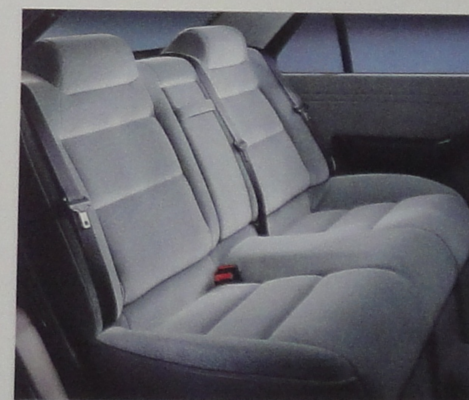
Trois ceintures à l'arrière et appuis-tête intégrés.