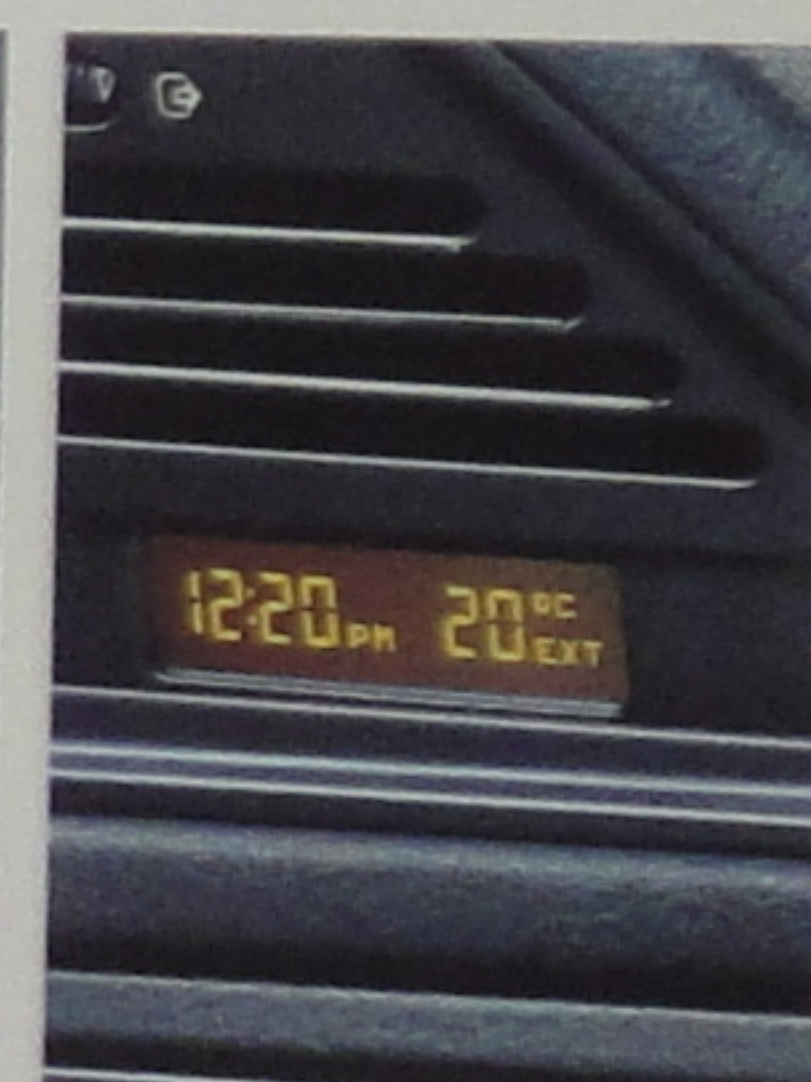
Affichage de la température extérieure.