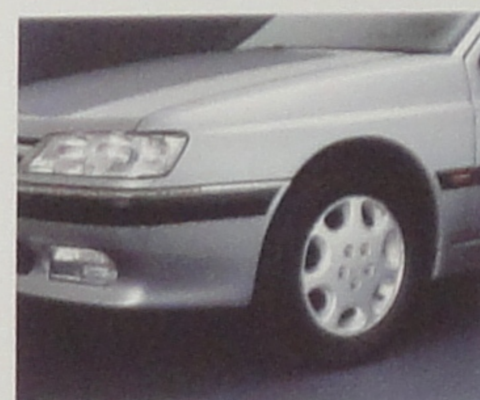
Peinture métallisée en option.

• Equipement de base / ○ Option. Outre la garantie légale toutes les Peugeot bénéficient d'une garantie d'un an pièces et main-d'œuvre sans limitation de kilométrage. Automobiles Peugeot se réserve le droit de modifier, sans préavis, les caractéristiques techniques et équipements des modèles présentés. * Injection électronique sur SVdt 2.5