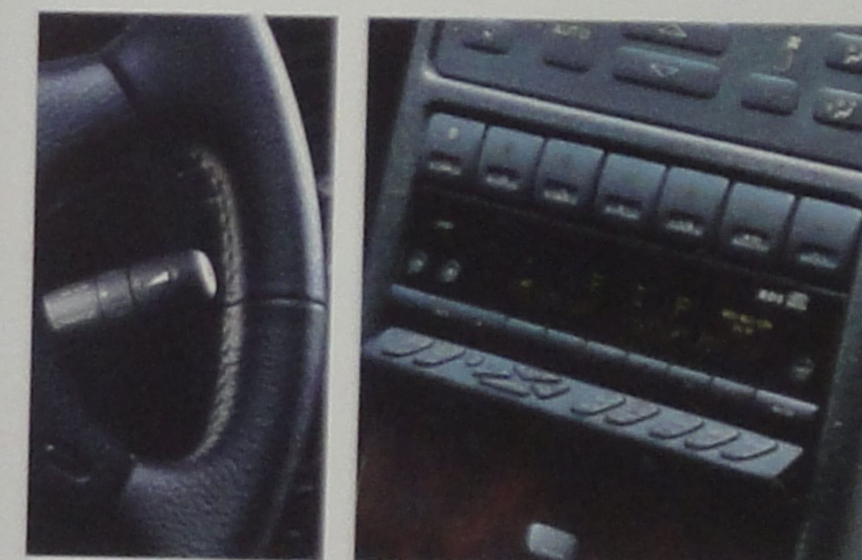
Autoradio avec commande au volant. Alarme volumétrique en option.