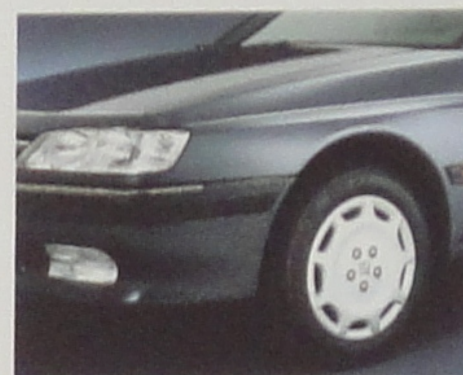
Peinture métallisée en option.

• Equipement de base / ○ Option. Outre la garantie légale toutes les Peugeot bénéficient d'une garantie d'un an pièces et main-d'œuvre sans limitation de kilométrage. Automobiles Peugeot se réserve le droit de modifier, sans préavis, les caractéristiques techniques et équipements des modèles présentés.