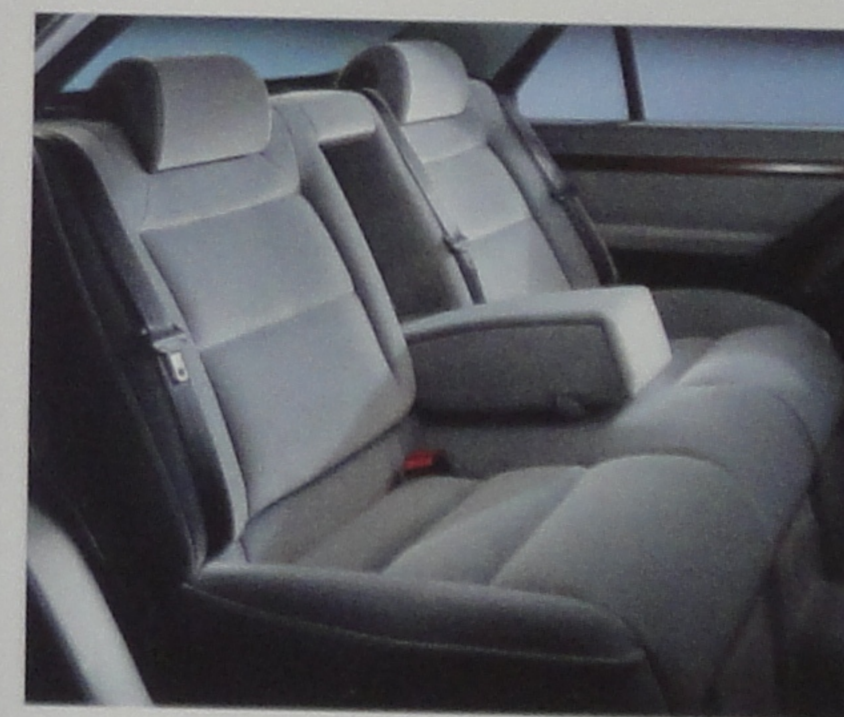
Appuis-tête arrière réglables en hauteur et horizontalement.