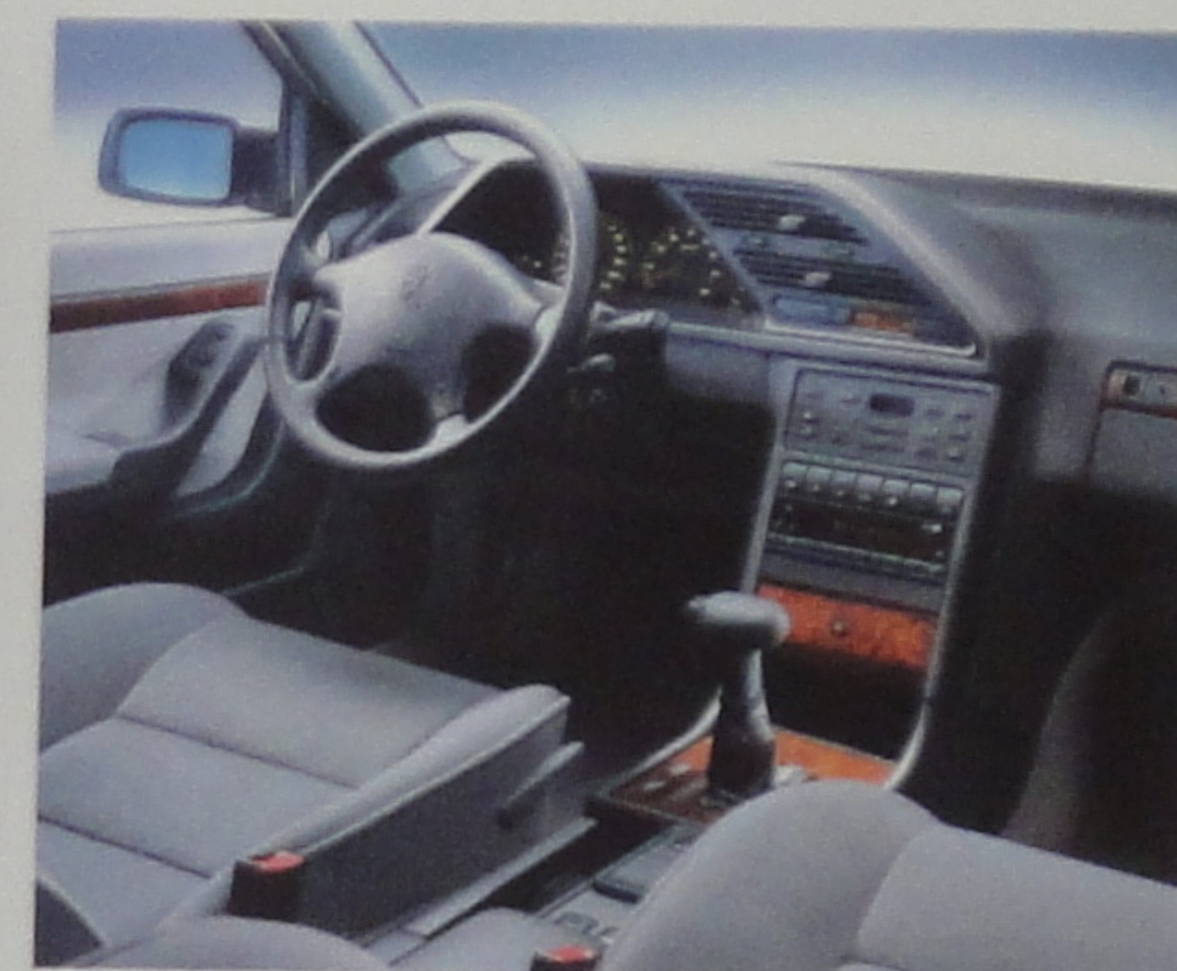
Volant gainé cuir et ronce de noyer.