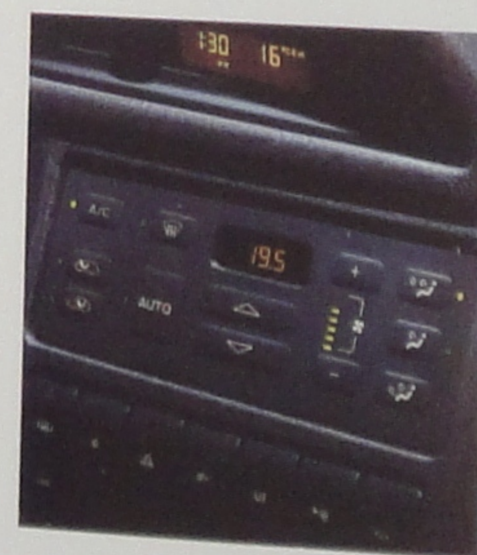
Air conditionné automatique.

Un autre monde. Avec une liste d'équipements d'une telle richesse qu'elle se confond presque avec l'inventaire des grandes innovations automobiles de notre temps.