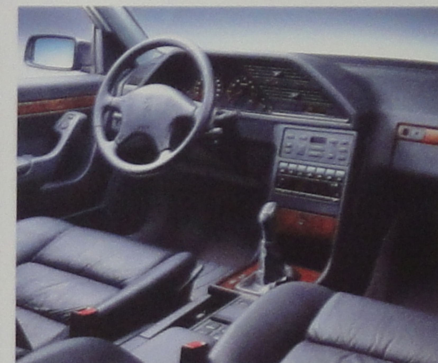
Tous les plaisirs de la conduite.

* Pour être tout à fait exact, il existe une option sur 605 SV24, la seule que nous n'avons pas voulu vous imposer : le preconditionnement radio-téléphone. Après tout, où peut-on encore espérer trouver un peu de tranquillité sinon dans une 605 SV24 ?