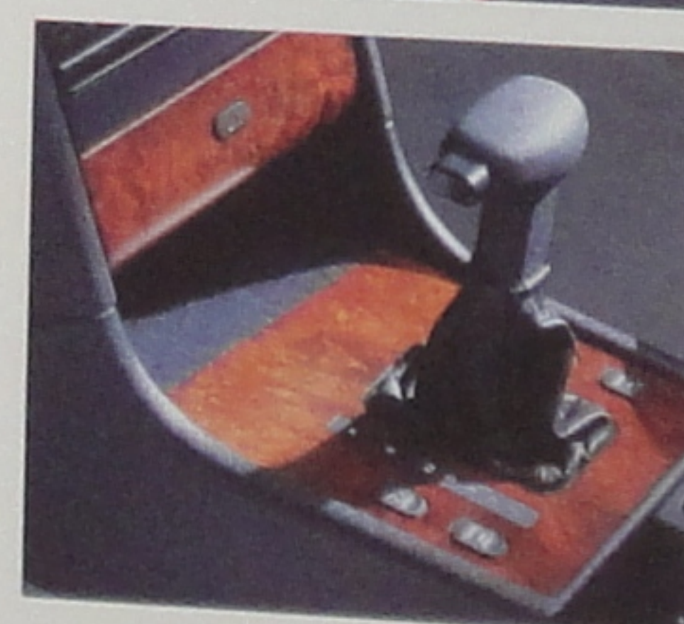
Boîte de vitesses automatique avec témoin sur le combiné du rapport engagé.