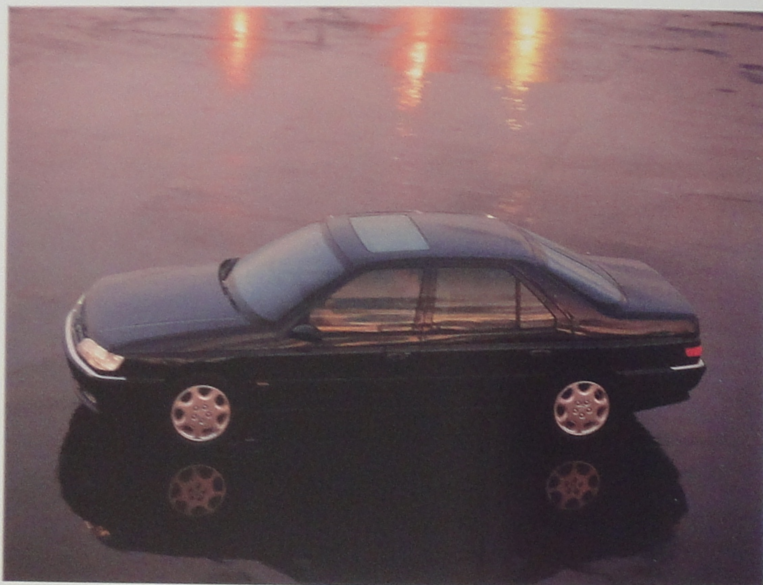
605 SV 3.0 avec toit ouvrant et peinture métallisée en option.