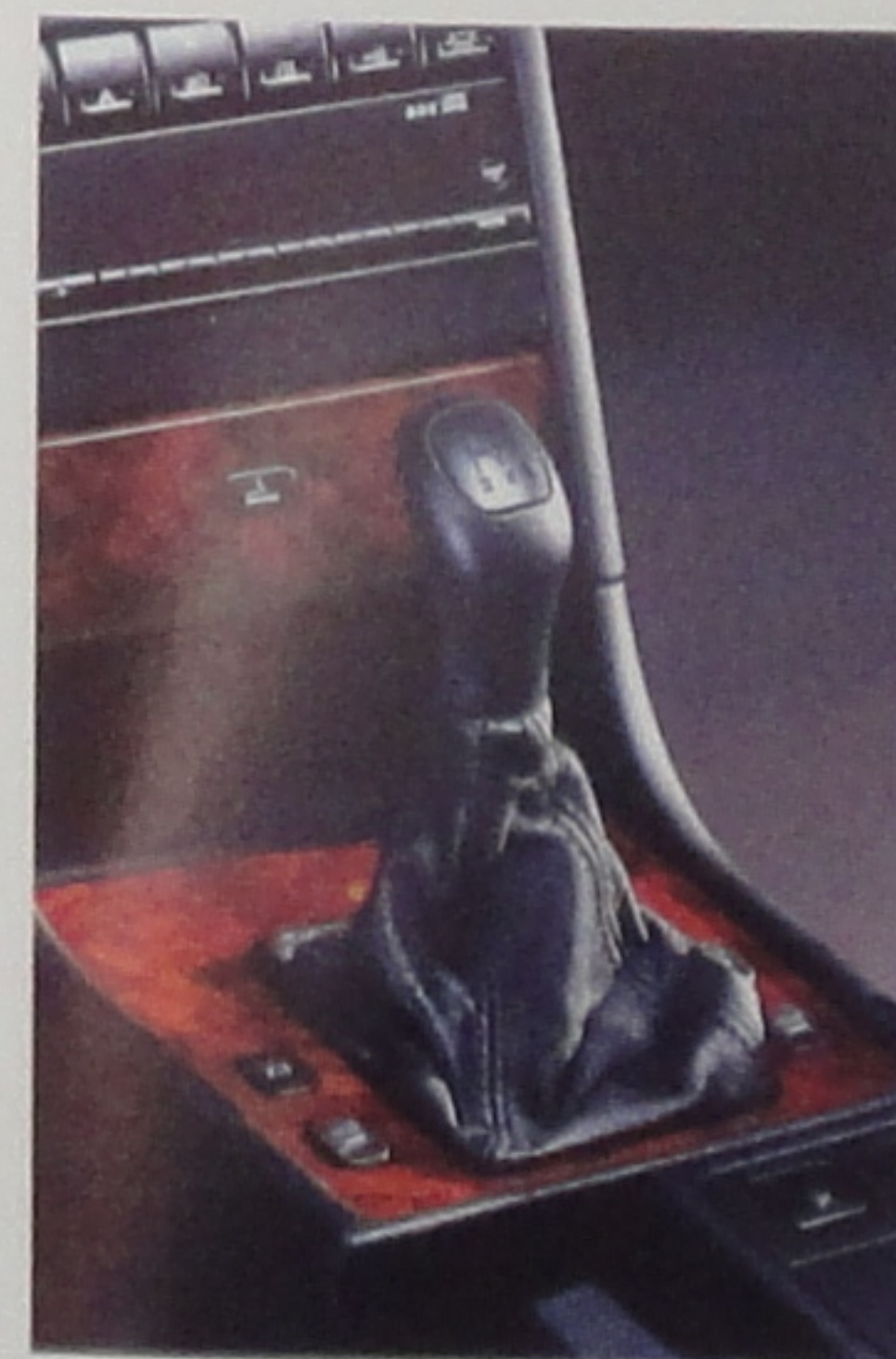
Soufflet de levier de vitesses gainé cuir.

Au faite de la gamme, 605 SV24 règne en souveraine. Sous ses ordres, les 200 ch du 6 cylindres 24 soupapes. Singulière, elle ignore jusqu'à l'existence du mot option*. Plénitude.