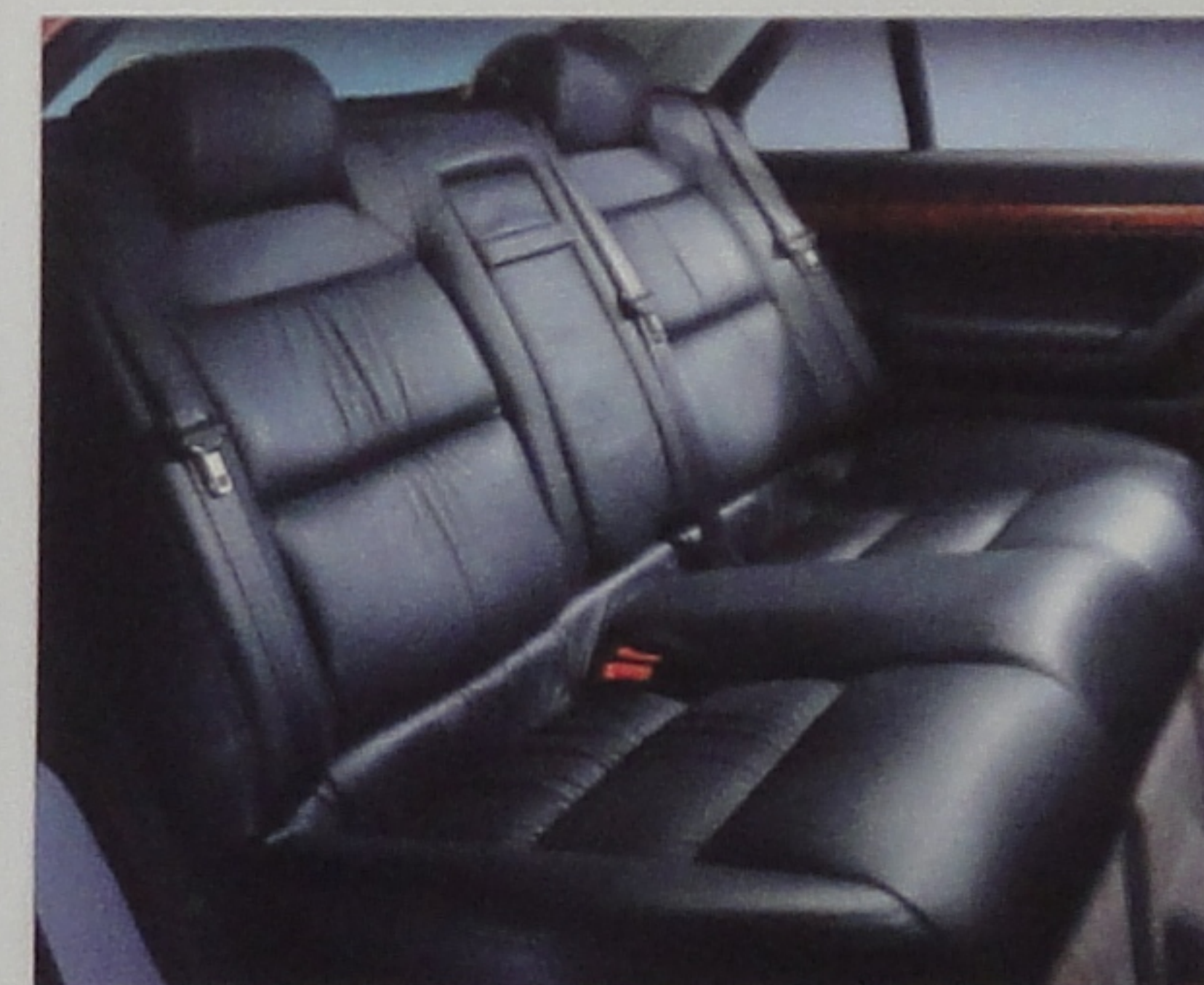
Confort et souplesse du cuir.