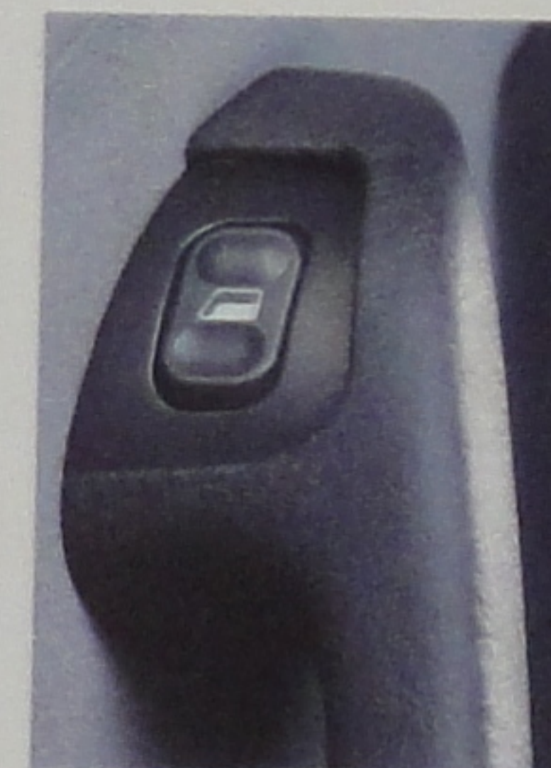
Lève-vitres arrière électrique.