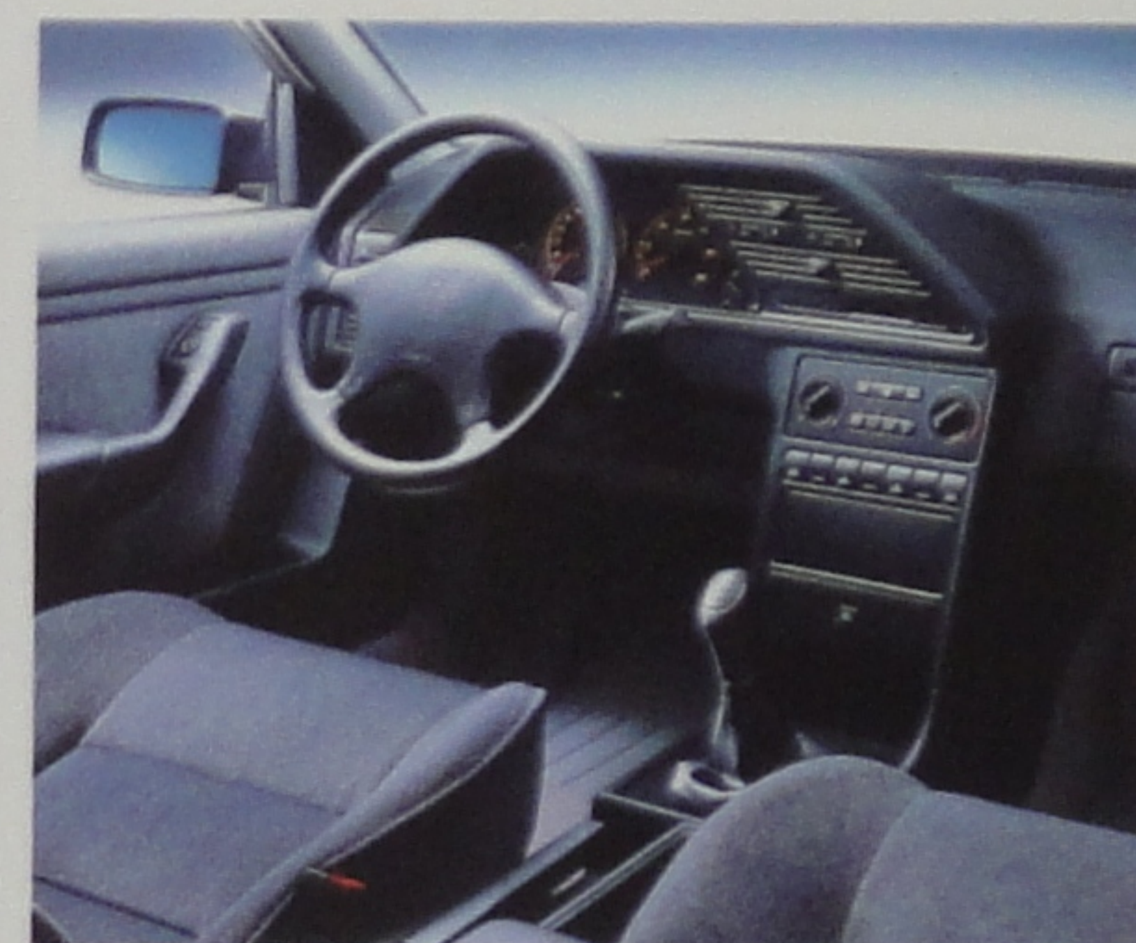
Sièges tendus de velours et sac gonflable conducteur.