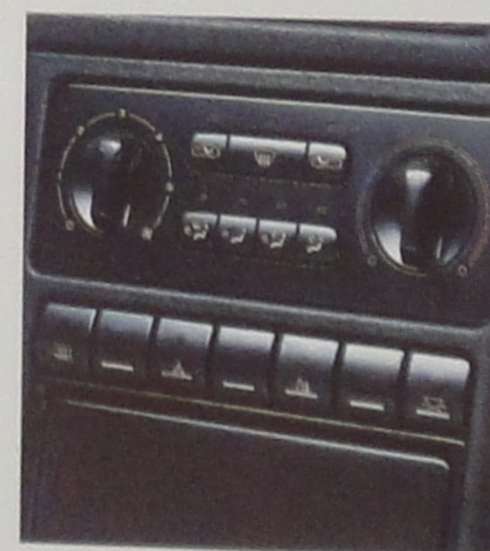
Commandes de chauffage à réglage séparé droite/gauche.

Premier pas dans l'univers intemporel de 605. Déjà tous les signes du renouveau. Déjà une exigence de confort et de sécurité poussée à son plus haut niveau.