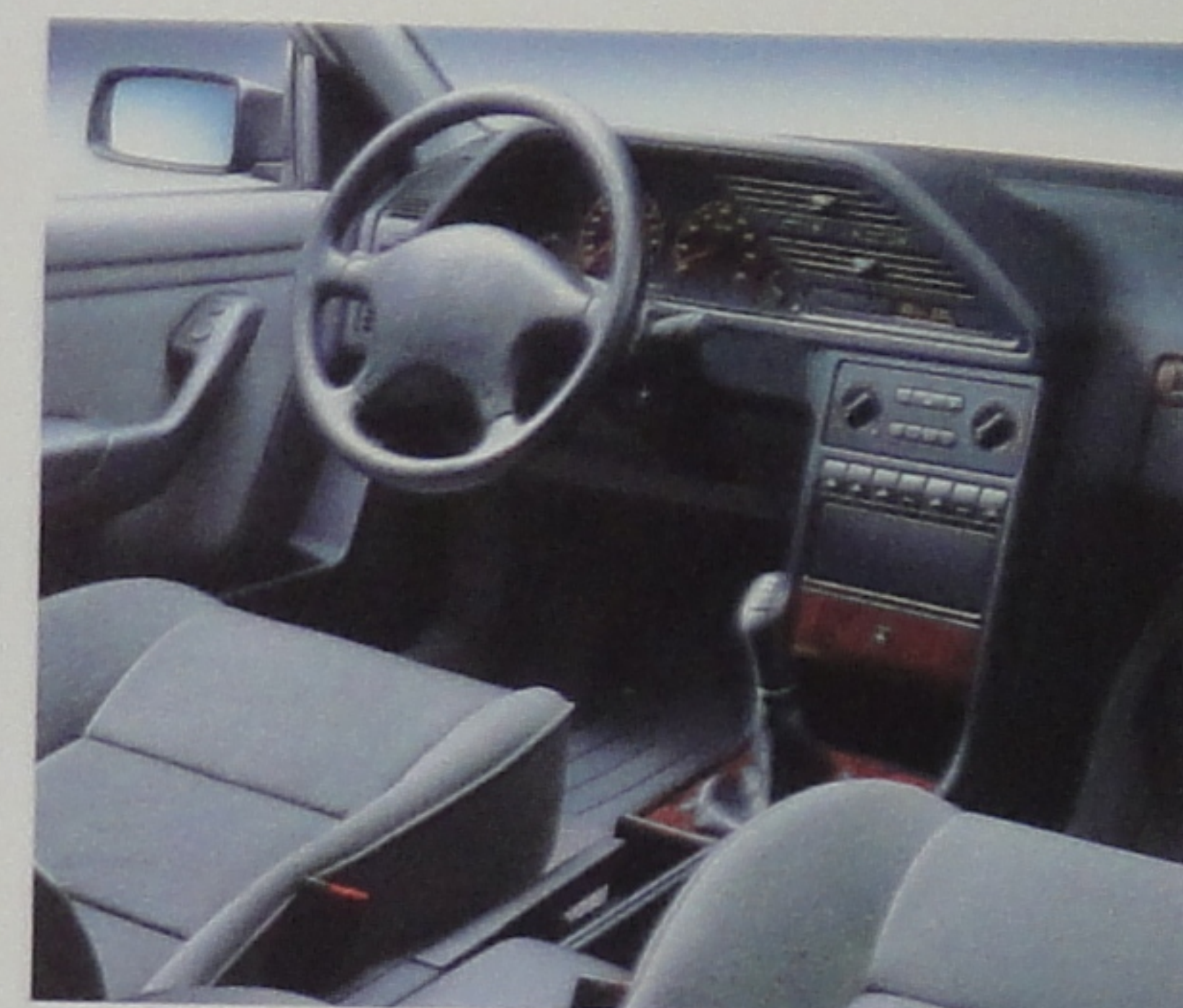
Confort de conduite et plaisir des matières.