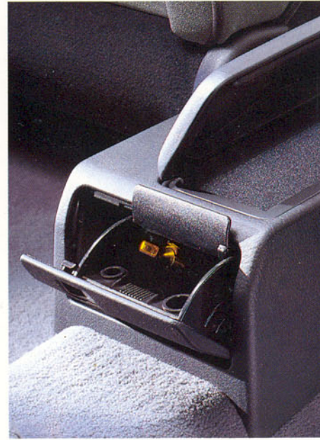
Cendrier arrière et vide-poches central avec couvrecl