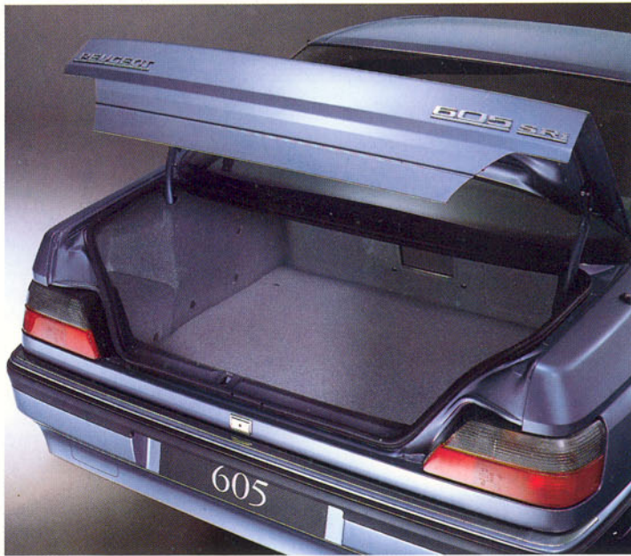
Coffre garni de moquette, avec éclairage