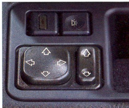
Réglage électrique des rétroviseurs et commande des plafonniers avant/arrière