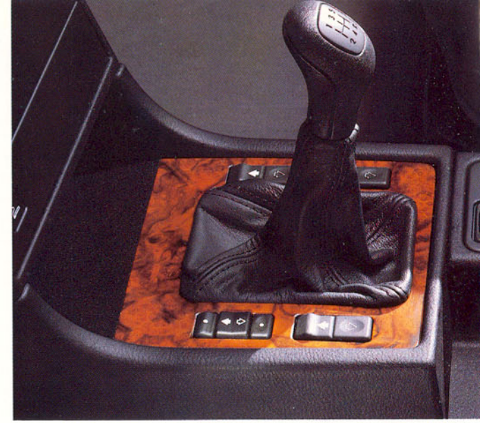
Enjoliveur ronce de noyer sur console centrale avec lève-vitres électriques avant/arrière (séquentiel côté conducteur)