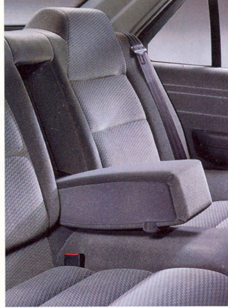
Accoudoir central arrière escamotable et trappe à skis