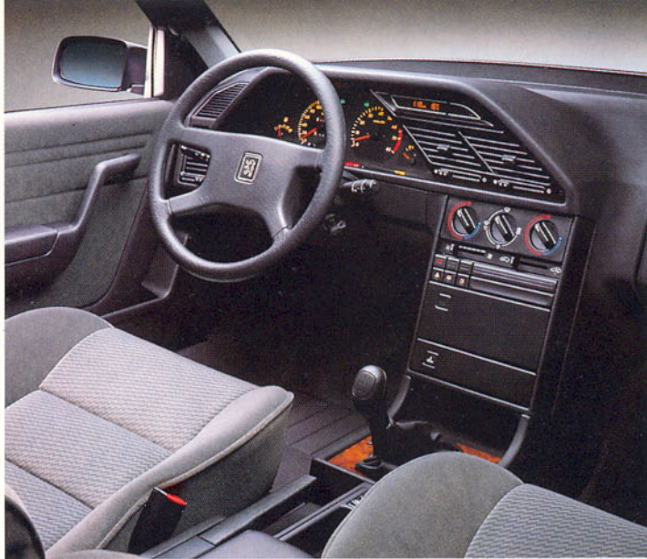
Poste de conduite