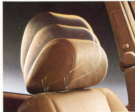
Appui-tête avant réglables en hauteur et en inclinaison