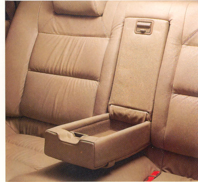
Sièges arrière garnis de cuir, bac de rangement avec couvercle