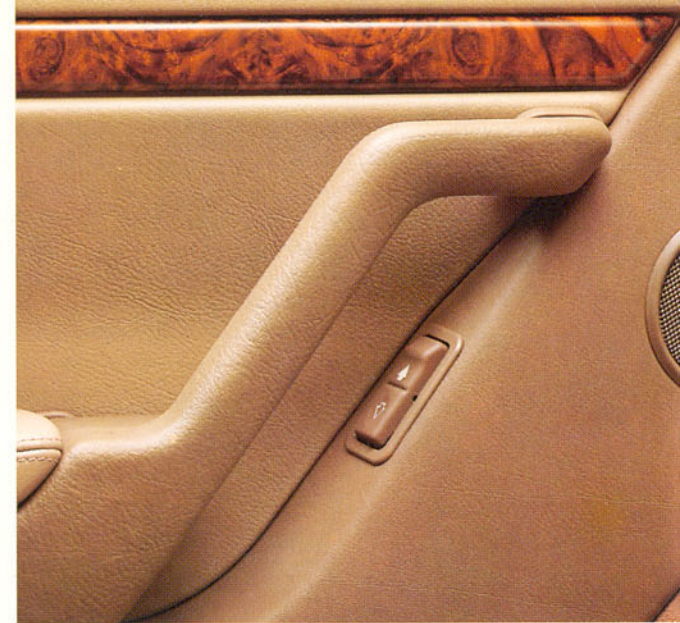
Lève-vitre électrique et haut-parleur de porte arrière