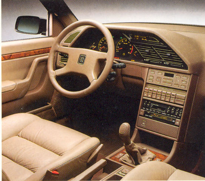
Sièges avant et volant garnis de cuir/commandes d'air conditionné automatique