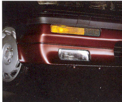
Phare anti-brouillard et lave-projecteurs télescopique