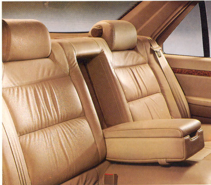
Sièges arrière garnis de cuir, accoudoir central avec bac de rangement