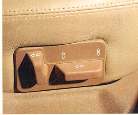
Commandes électriques de réglage des sièges avant