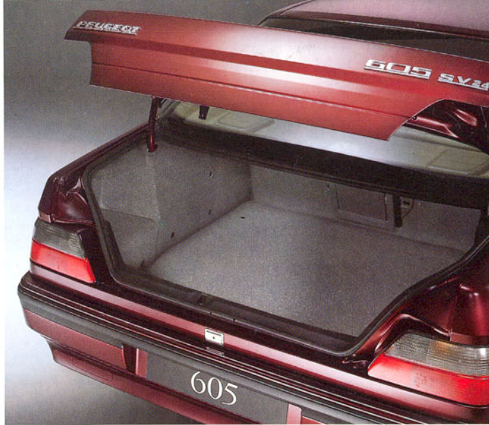
Coffre avec éclairage et housse de trappe à skis