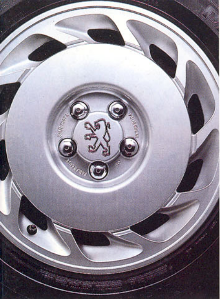
Jante en alliage léger et pneumatique 205/55ZR16