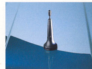
Antenne téléphone en option.