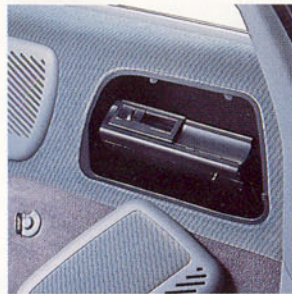
Chargeur CD (en option).