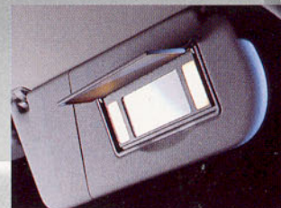
Miroir de courtoisie passager, occultable avec éclairage.