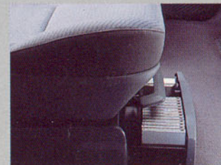
Tiroir de rangement sous les sièges avant.