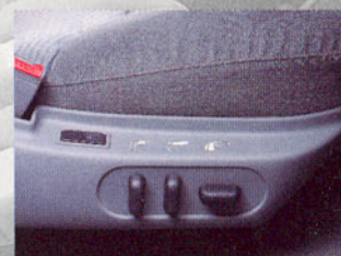
Commandes électriques de réglage de siège avant (en option).