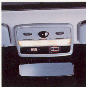
Console de pavillon avec localisateur de portes ouvertes et commandes électriques de custodes.