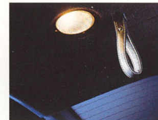
Eclairage et dragonne de volet arrière.