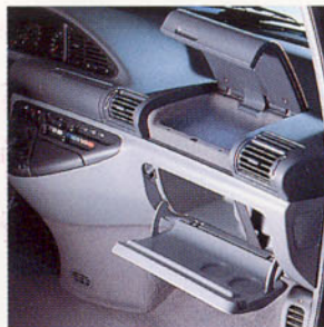
Double boîte à gants.