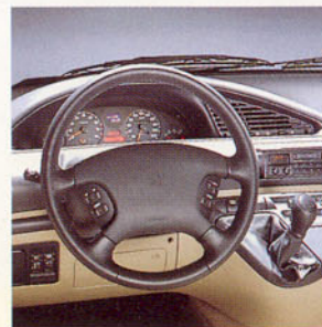
Volant avec sac gonflable (airbag) en option.