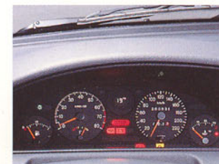
Combiné avec ordinateur de bord.