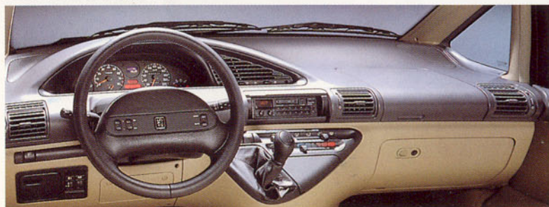
Poste de conduite avec commandes radio au volant.