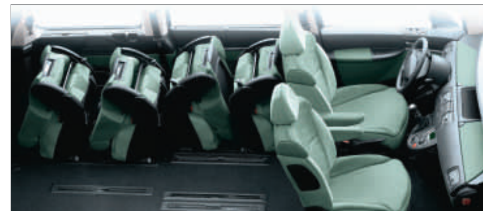
Configuration "Cargo", 4 sièges en portefeuille sur la même rangée.