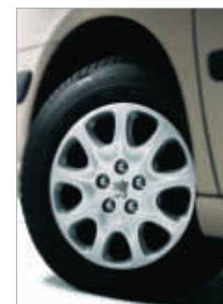
Enjoliveur Adagio 15 pouces (sauf sur version SV).