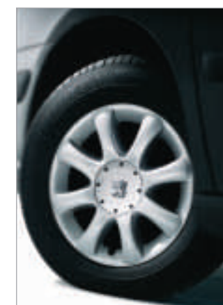
Roue aluminium Largo 15 pouces (de série sur version SV) ou 16 pouces (de série sur version 3.0 I 6 cylindres).