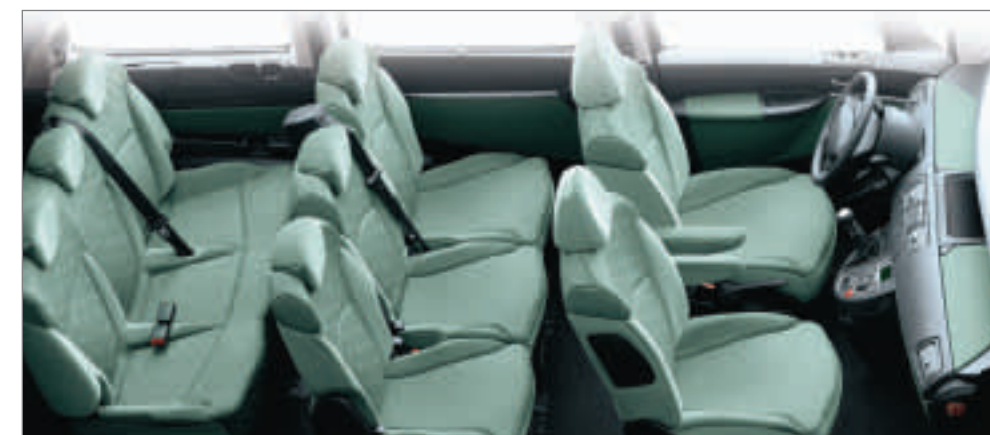
8 places (option banquette en 3 e rangée).