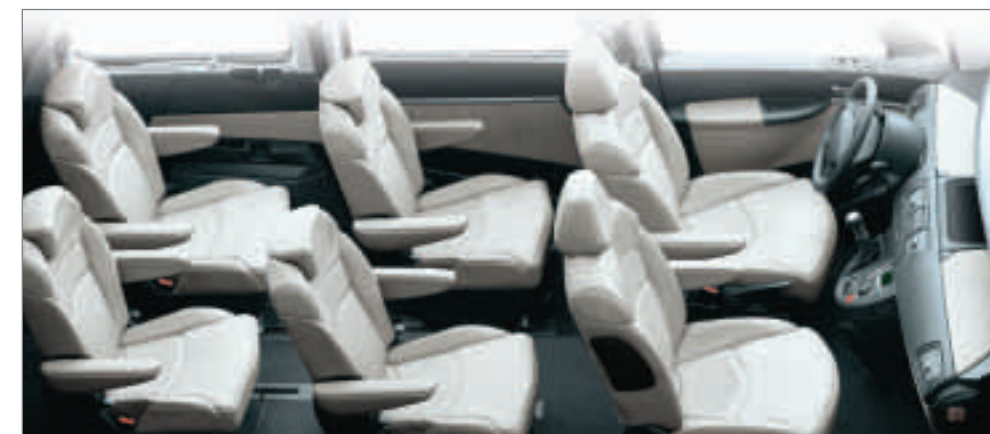
Version Pullman (6 places) présentée avec option cuir.