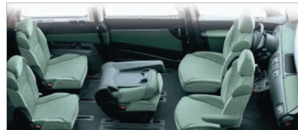
5 sièges configuration "Salon".

Afin de répondre à toutes vos attentes, en semaine ou en week-end, la nouvelle Peugeot 807 se prête à toutes les configurations (2,5,7,8 places...), immédiatement et sans effort.