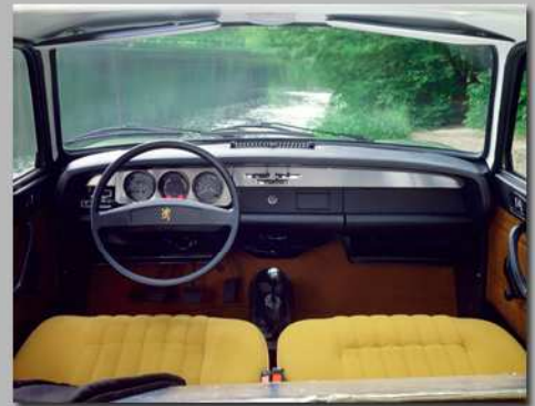
304 Coupé, 1975