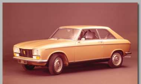
304 Coupé, 1975