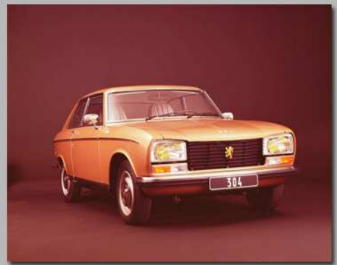
304 Coupé, 1975

Sa construction s'arrêtera en 1980 après 1.178.423 ex. produits toutes versions confondue.