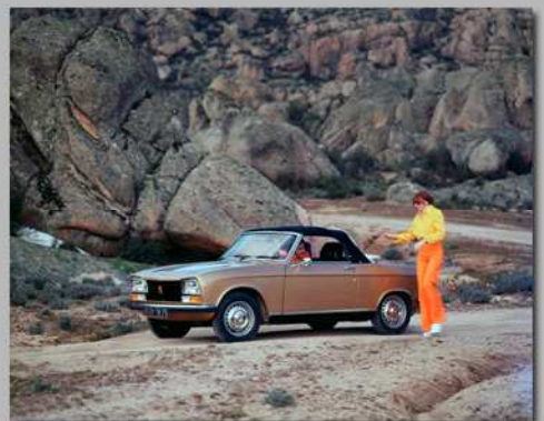
304 Cabriolet, 1973