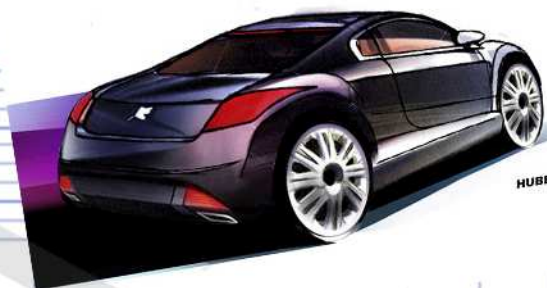
Plouf Peugeot 708