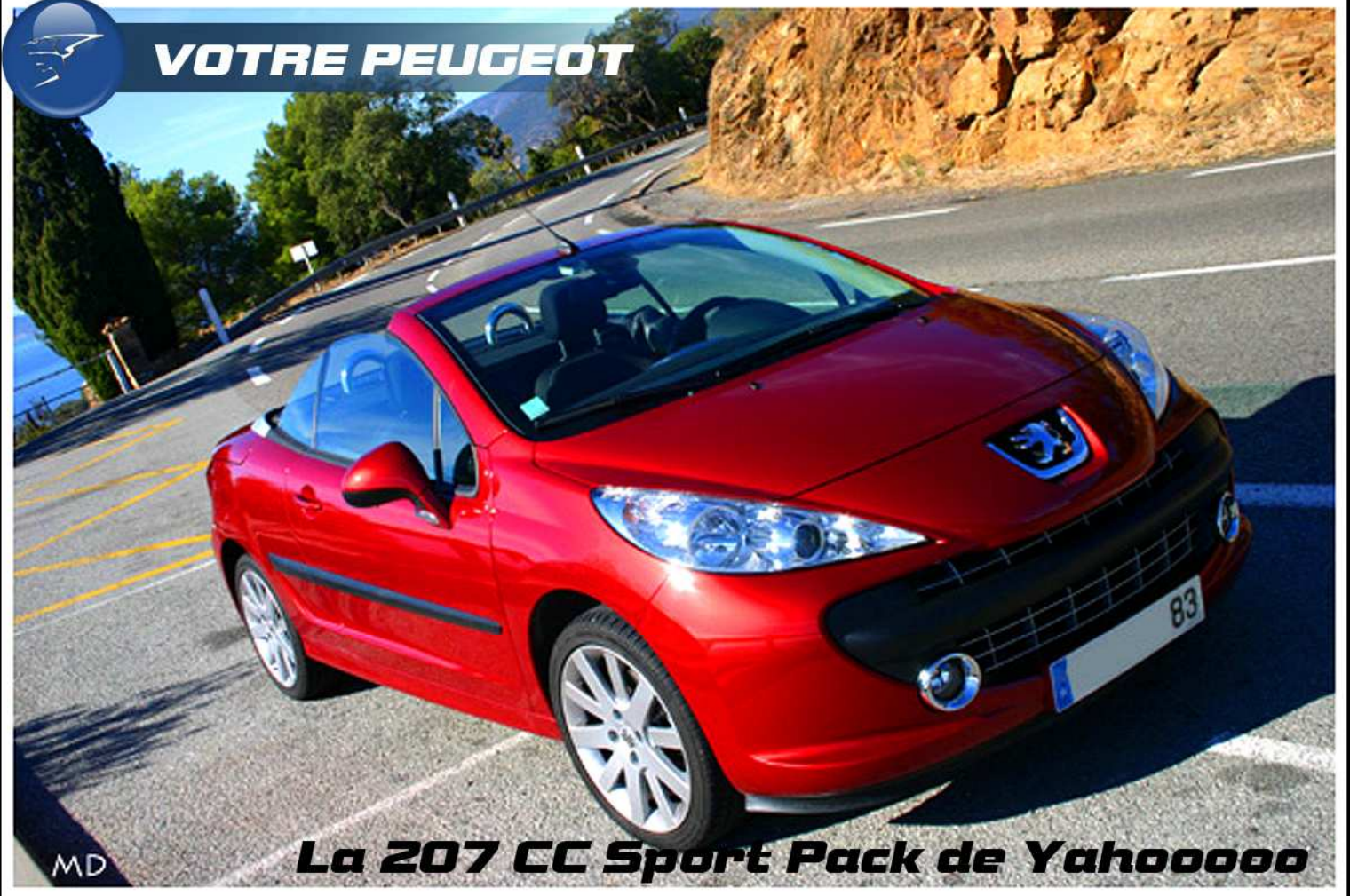
La 207 CC Sport Pack de Yahoooooo