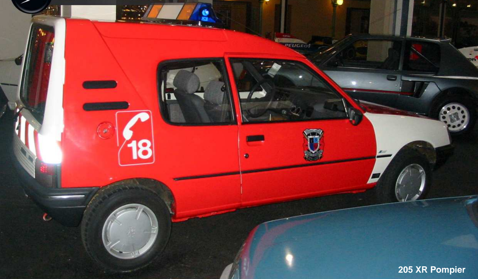
205 XR Pompier