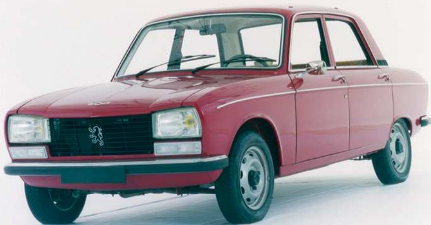
304 berline, 1969