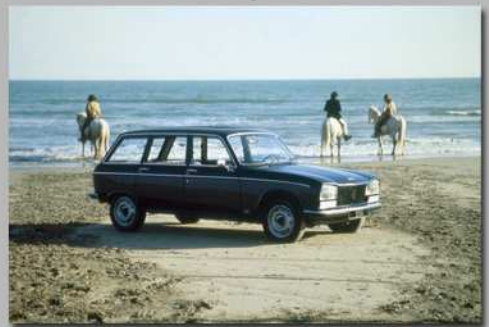
304 Break, 1971