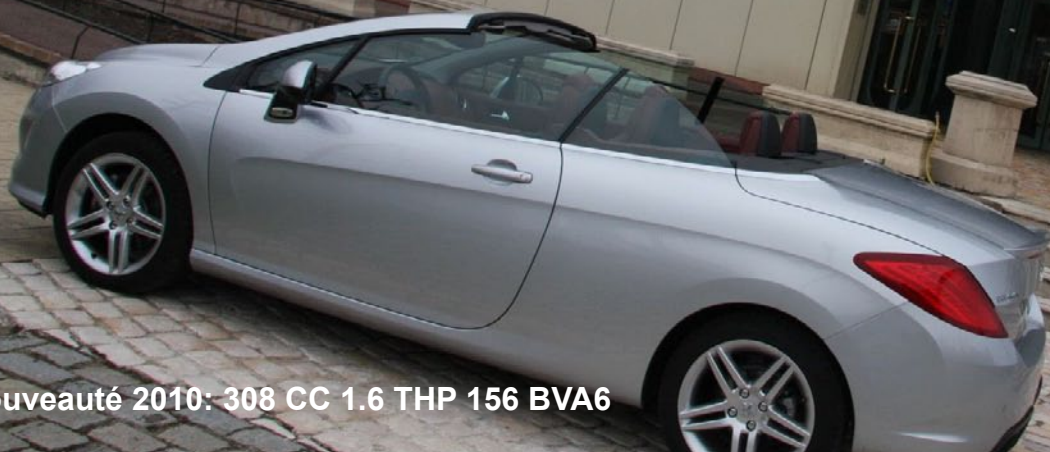
Nouveauté 2010: 308 CC 1.6 THP 156 BVA6