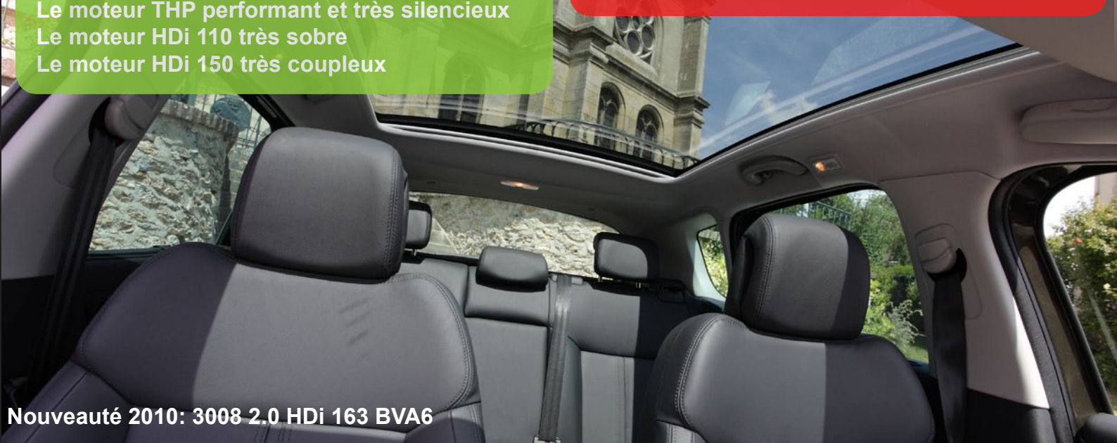
Nouveauté 2010: 3008 2.0 HDi 163 BVA6