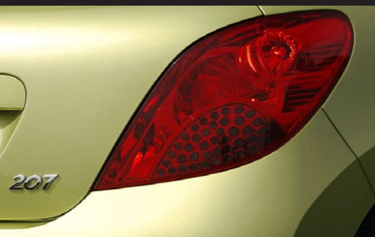
Ci-dessous, feux arrière des premières Peugeot 207 décriés pour leur mauvaise visibilité par temps de pluie remplacés par de nouveaux feux avec rampes de diodes