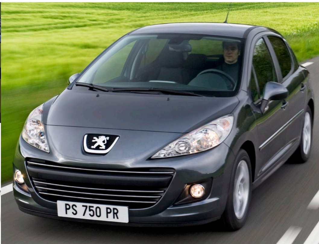
Ci-dessus, à gauche les faces avant classic et sport des premières générations de 207 (2006) et la droite le nouveau bouclier avant des nouvelles 207 (2009)