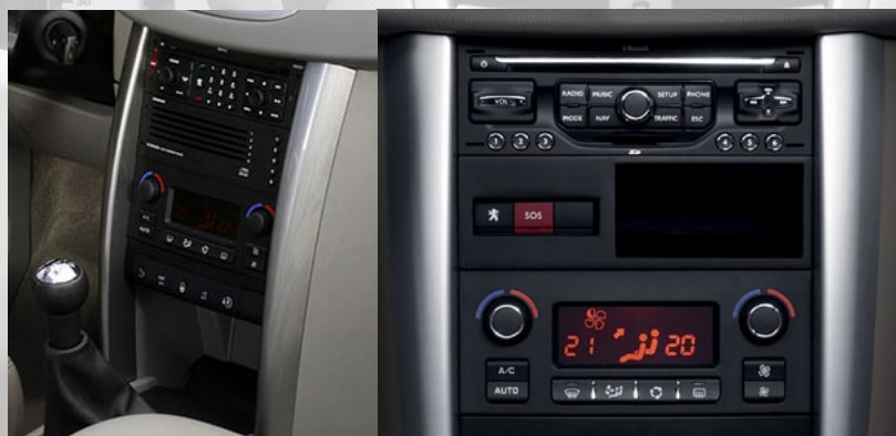
Ci-dessus à gauche, la façade technique des premières 207 et à droite des nouvelles 207 avec le WIP Nav, l'appel d'urgence et la nouvelle console de climatisation