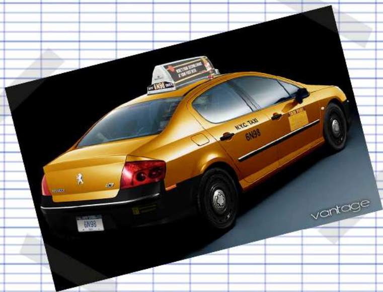
Vantage 407 New York Taxi