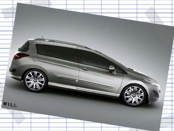
Will 308 Break de Chasse