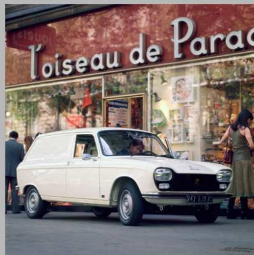
204 Fourgonnette, 1975