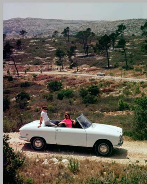
204 Cabriolet, 1965