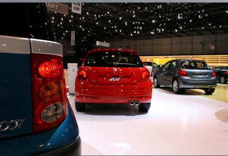
Voici en images, le reste de la gamme exposée.