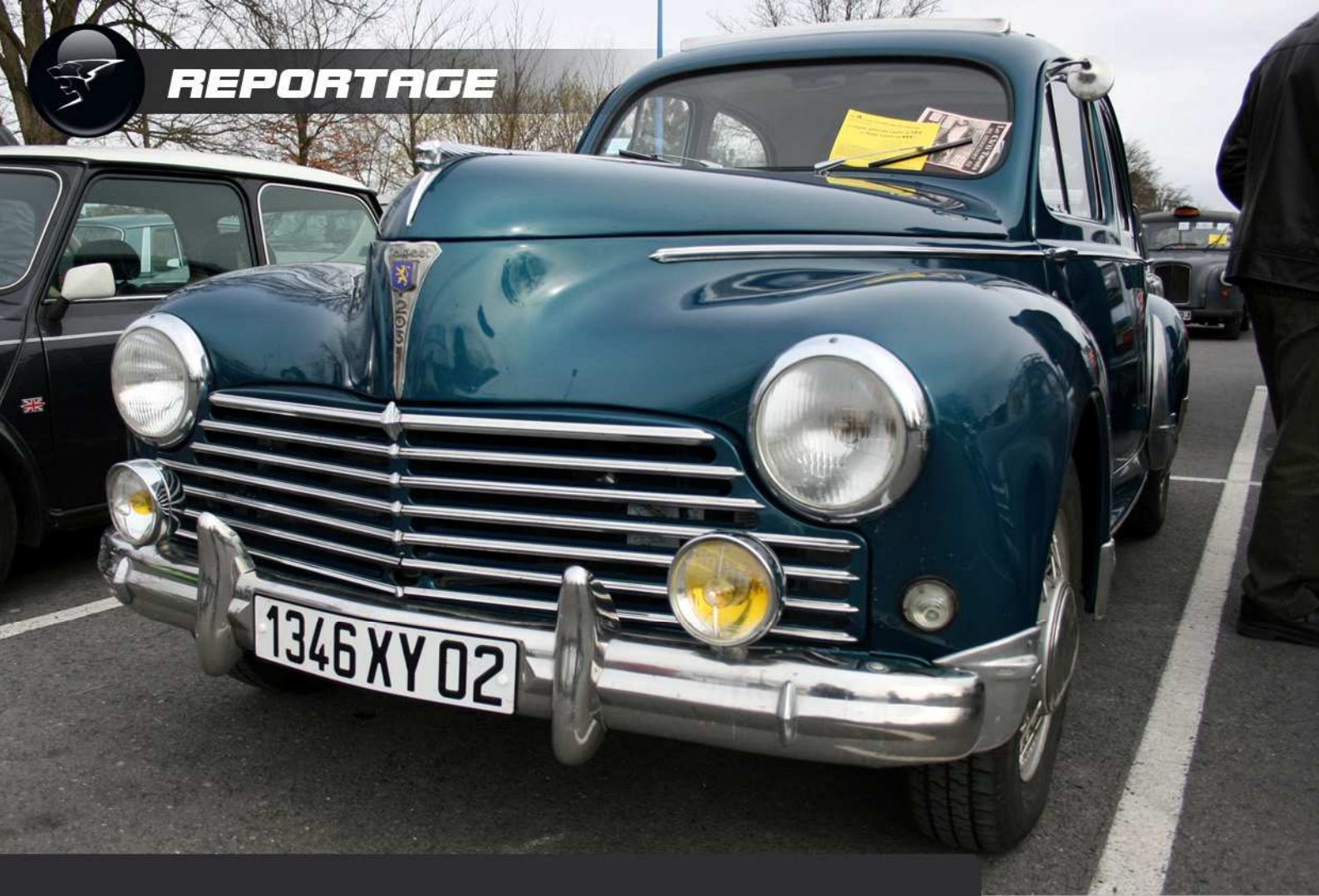
Ci-dessus, une magnifique Peugeot 203 de couleur Bleu Turquoise.