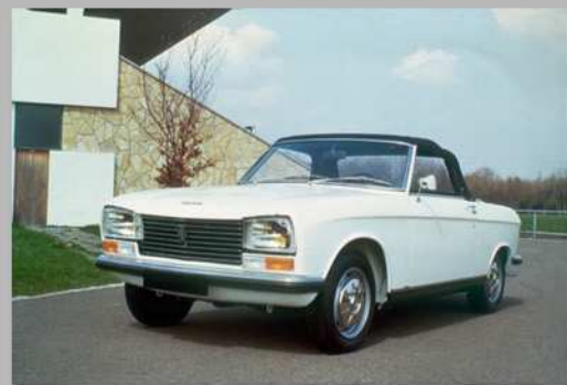
204 Cabriolet, 1965

Dates de production : 1965 - 1976 Production totale : 1 604 296 exemplaires Modèle précédent : Peugeot 203 Modèle suivant : Peugeot 104