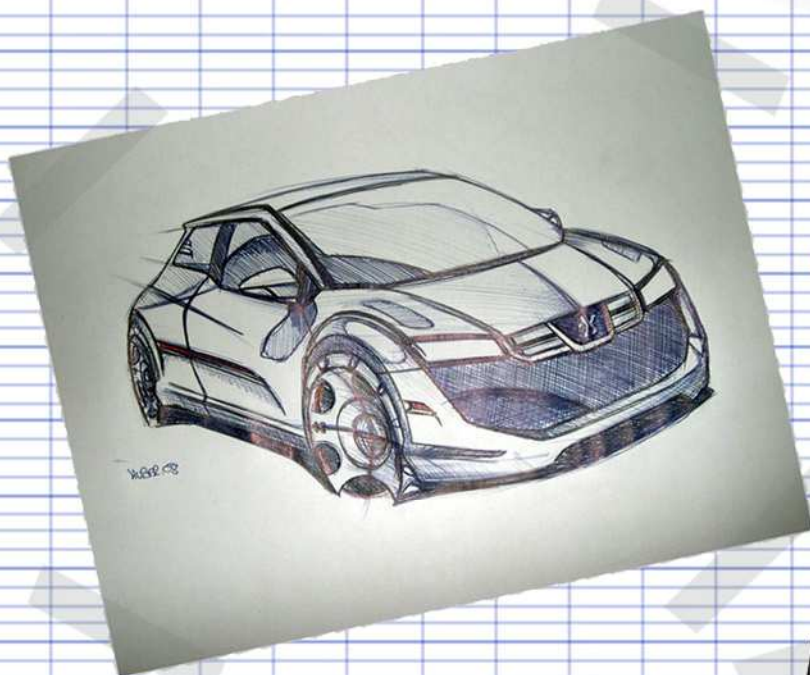
Huber08 Remake 205 GTi