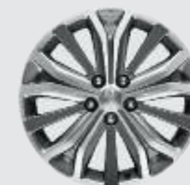
Jante aluminium 18"