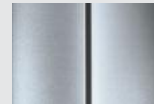
Gris Cool Silver