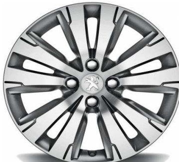
Jante Aluminium 17" AREGIA Diamantée Gris Anthra