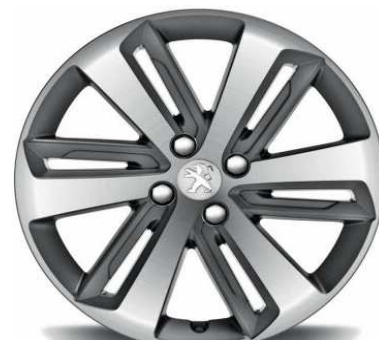
Jante Aluminium 18" ICAUNA Diamantée Gris Anthra