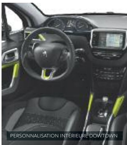
PERSONNALISATION INTÉRIEURE DOWNTOWN