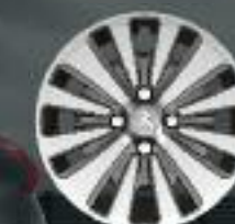
16" Enjoliveur Strontium (2)