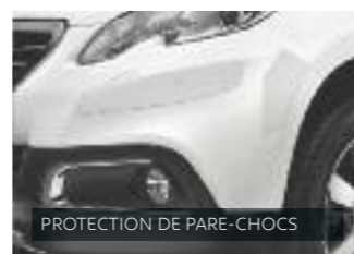
PROTECTION DE PARE-CHOC