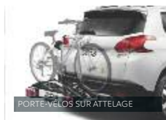
PORTE-VÉLOS SUR ATTELAGE