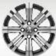
Jante alliage 16" Cetus