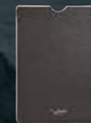
Étui pour tablette en cuir marron