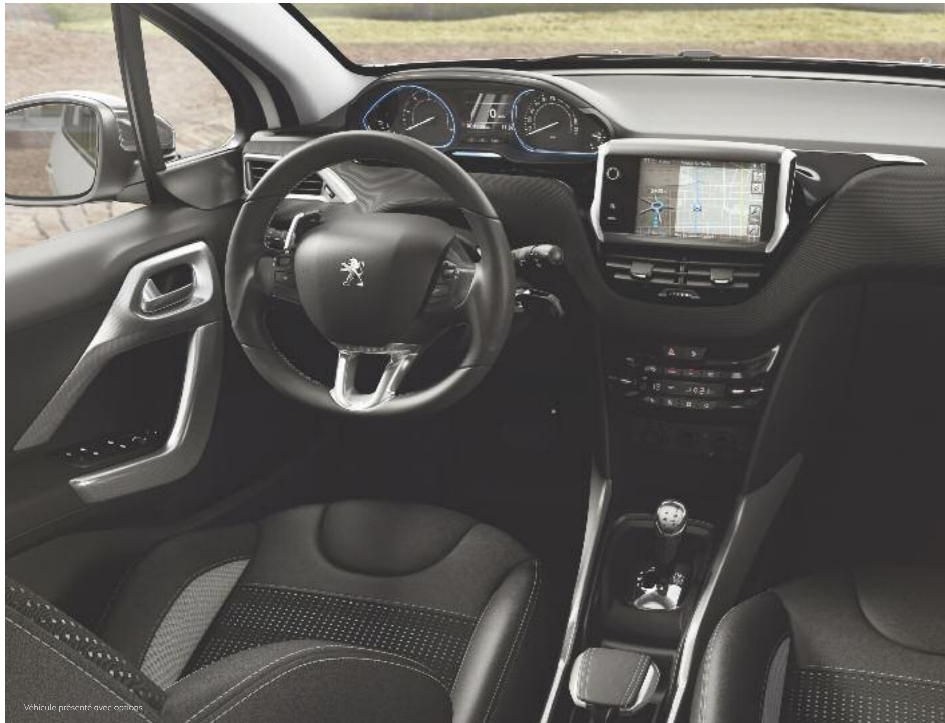
Véhicule présenté avec options