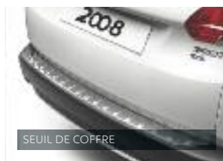
SEUIL DE COFFRE