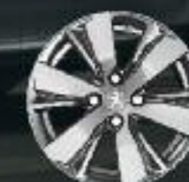
16" Roue diamantée Hydre Gris Dilium Brillant (3)