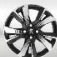
Jante alliage 17" Pyxis