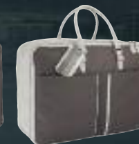
Valisette en cuir gris perla et TEP brun