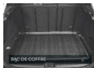
BAC DE COFFRE