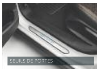
SEUILS DE PORTES