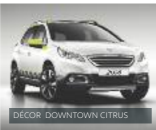
DÉCOR DOWNTOWN CITRUS