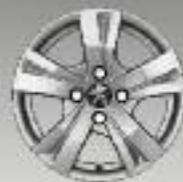
Jante alliage 15" Draco