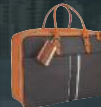
Valisette en cuir orange et TEP brun

Découvrez la ligne de style 2008 qui vous accompagnera avec élégance lors de vos déplacements.