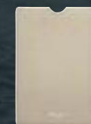
Étui pour tablette en cuir gris perla