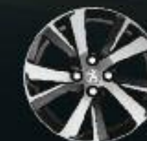
17" Roue diamantée Eridan Noir Brillant (5)