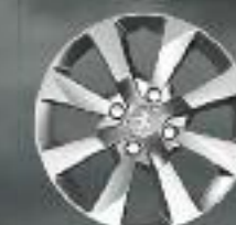
15" Enjoliveur Iode (1)

Un choix de différentes jantes est également disponible pour habiller votre 2008.