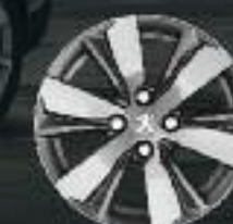
16" Roue diamantée Hydre Gris Ten Mat (3)