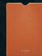
Étui pour tablette en cuir orange