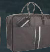
Valisette en cuir marron et TEP brun