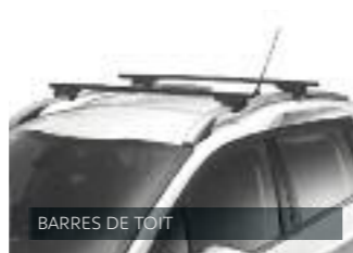
BARRES DE TOIT