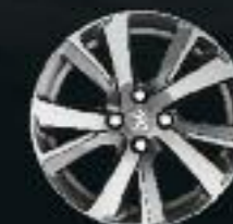
17" Roue diamantée Eridan Gris Mat (4)