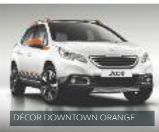
DÉCOR DOWNTOWN ORANGE