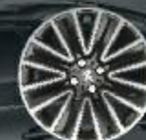
16" Enjoliveur Silice (2)