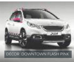
DÉCOR DOWNTOWN FLASH PINK