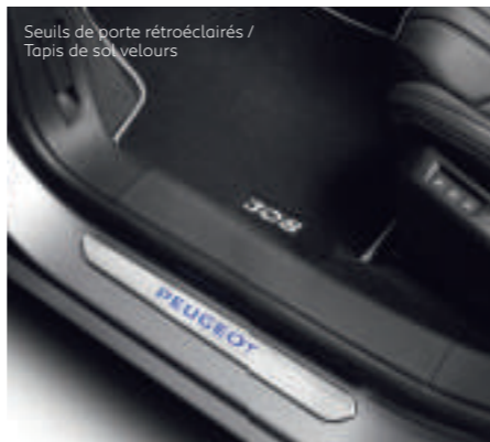
Seuils de porte rétroéclairés / Tapis de sol velours