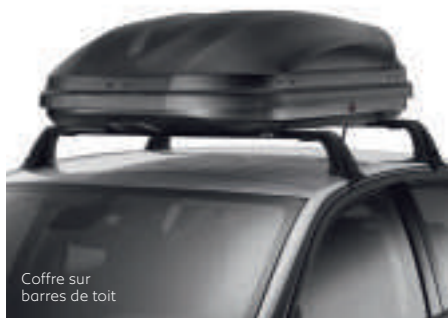
Coffre sur barres de toit