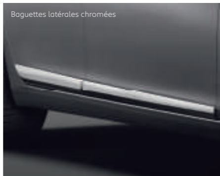
Baguettes latérales chromées