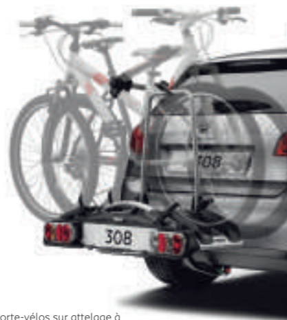
Porte-vélos sur attelage à rotule démontable sans outil