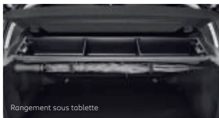
Rangement sous tablette