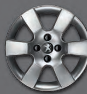
Jante 16" ERIS*