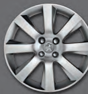
Jante 18" IXION*

*En série, en option ou indisponible selon les versions.