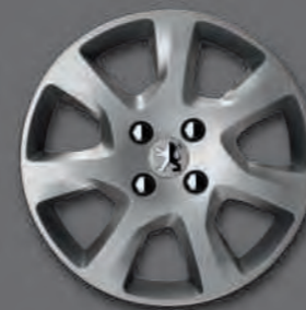
Enjoliveur 16" HAUMEA*

Un choix de jantes est disponible pour habiller votre 5008.