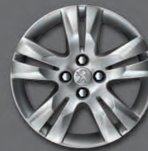
Jante 17" QUARK*