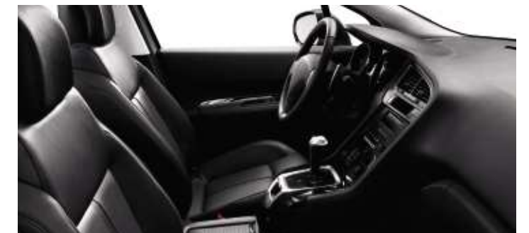
Cuir Noir Tramontane* (en option)