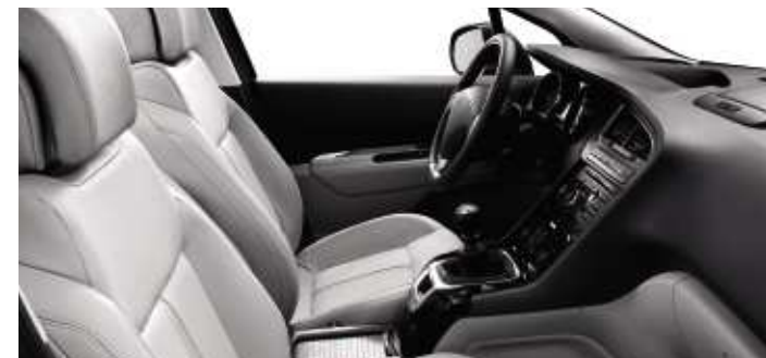
Cuir Guérande* (en option)