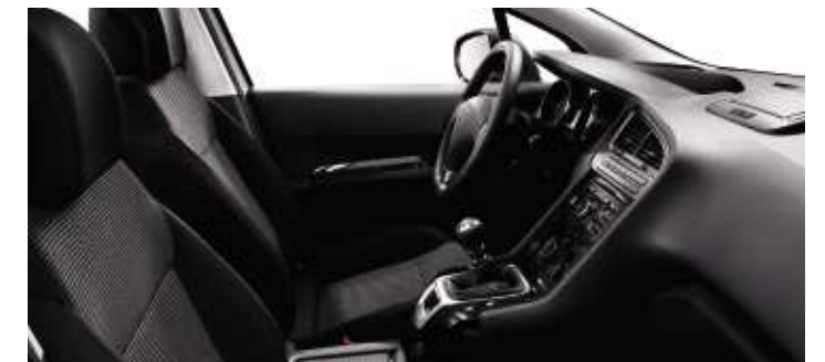
Tissu Strada Noir Tramontane