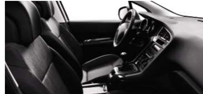
Tissu Ligne Noir Tramontane