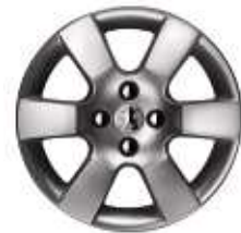
Jante 16" ERIS