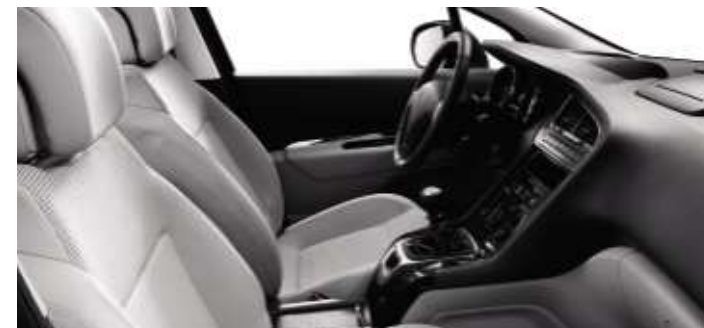
Tissu Strada Guérande