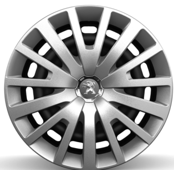
Enjoliveur 15" Ambre