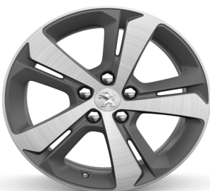
Jantes alliage 17" Diamantées RUBIS