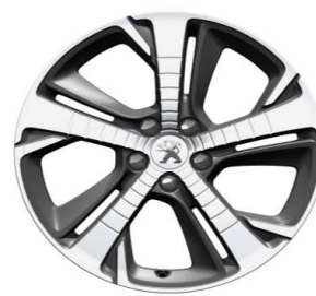
Jantes alliage 18" Diamantées DIAMANT