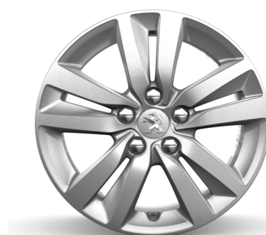
Jante Aluminium 16" QUARTZ