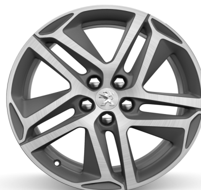
Jantes alliage 18" Diamantées SAPHIR