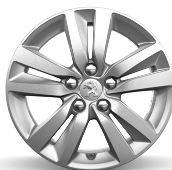
Jante alliage 16" QUARTZ