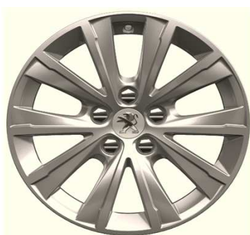
Jantes alliage 16" Pure TOPAZE