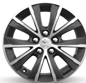
Jantes alliage 16" Diamantées TOPAZE