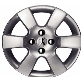
Jante alliage ERIS 16"