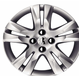
Jante alliage QUARK 17"