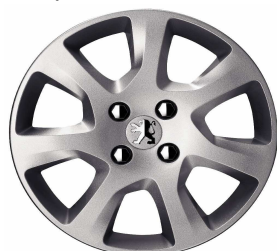
Enjoliveur HAUMEA 16"

Toutes les jantes de 5008 sont chaînables avec jeux réduits.