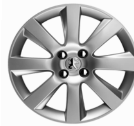
Jante alliage MAGNETIK 18"