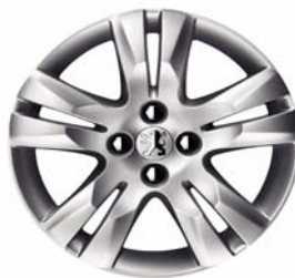
Jante alliage QUARK 17"