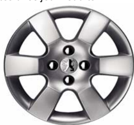
Jante alliage ERIS 16"