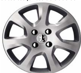
Enjoliveur HAUMEA 16"

Toutes les jantes de 5008 sont chaînables avec jeux réduits.