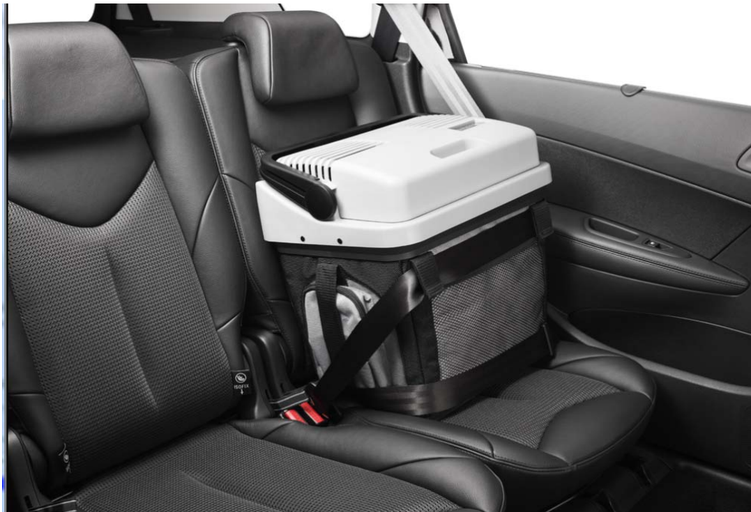
Module isotherme 24L WAECO (REF : 1607002980)

ACCESSOIRES POST USINE EN SERIE SUR VOTRE SERIE SPECIALE FAMILY