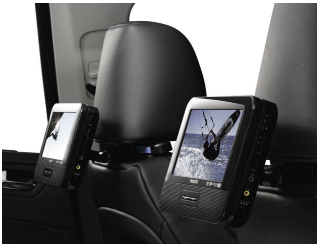
Lecteur DVD double écran PHILIPS (REF : 1606623280)