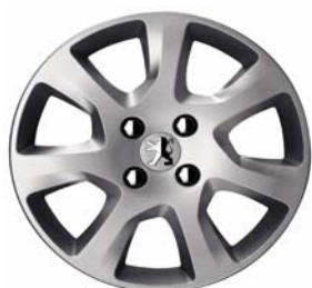
Enjoliveur HAUMEA 16"

Toutes les jantes de 5008 sont chaînables avec jeux réduits.