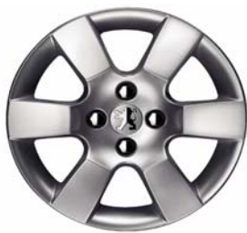
Jante alliage ERIS 16"