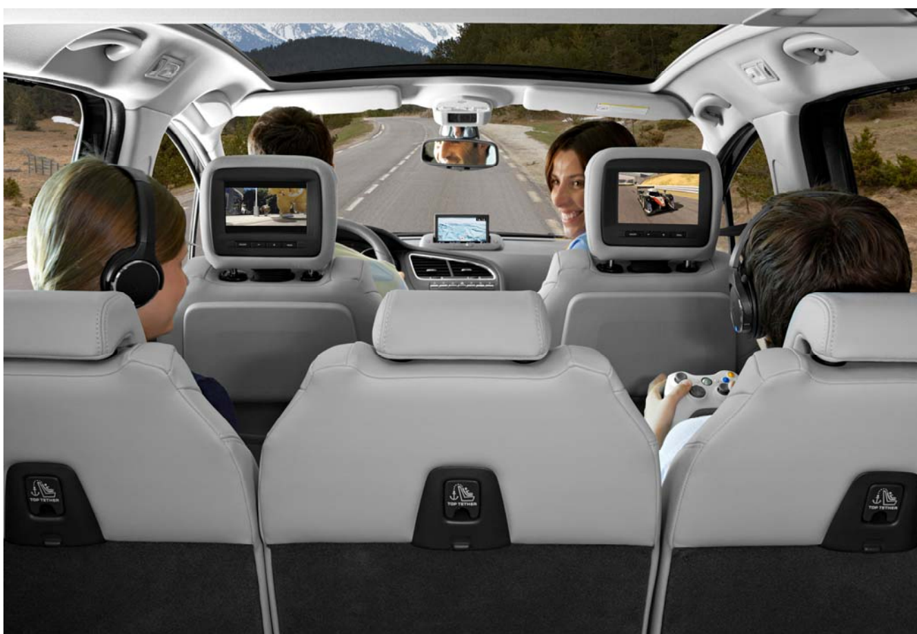
Lecteur de DVD portable TAKARA REF : 9702GZ

Lecteur DVD avec moniteur rotatif 7 pouces blanc, prise USB / Lecteur SD Card; livré avec 1 câble mini-jack / 3 RCA femelle pour raccorder aux écrans intégrés ( uniquement dans 5008 ); compatible des formats MPEG4/CD audio/CDR/CDRW/MP3.