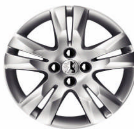
Jante alliage QUARK 17"