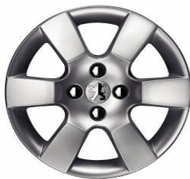
Jante alliage ERIS 16"