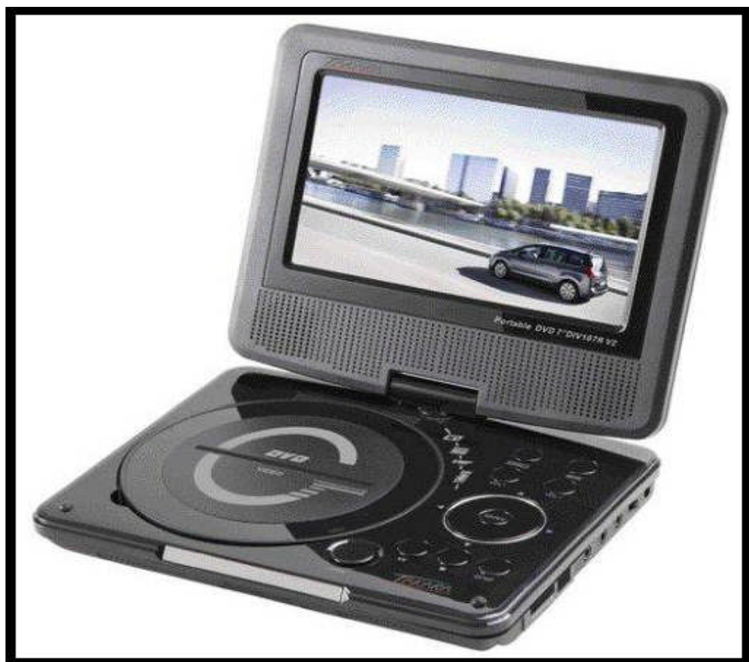
Lecteur de DVD portable TAKARA REF : 9702GZ