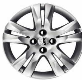
Jante alliage QUARK 17"