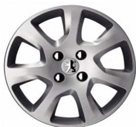
Enjoliveur HAUMEA 16"

Toutes les jantes de 5008 sont chaînables avec jeux réduits.