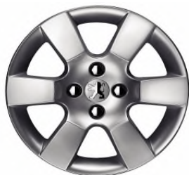
Jante alliage ERIS 16"