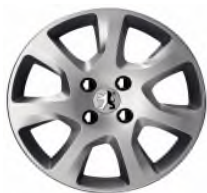
Enjoliveur HAUMEA 16" "

Toutes les jantes de 5008 sont chaînables avec jeux réduits.