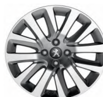
Jante alliage CALISTO 17" Diamantée