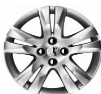
Jante alliage QUARK 17"