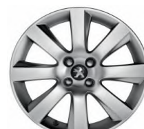
Jante alliage IXION 18"