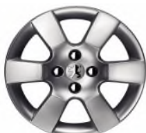
Jante alliage ERIS 16"