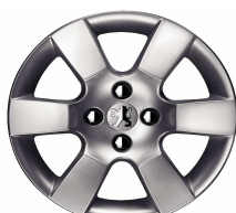
Jante alliage ERIS 16"