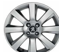
Jante alliage IXION 18"