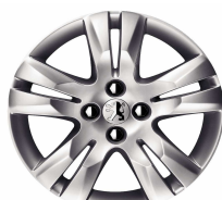
Jante alliage QUARK 17"