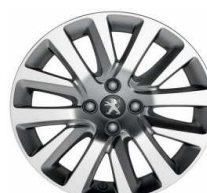
Jante alliage CALISTO 17" Diamantée