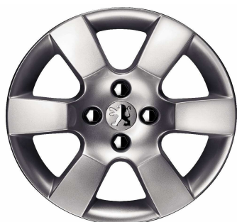
Jante Aluminium 16" ERIS

Toutes les jantes de 5008 sont chaînables avec jeux réduits.