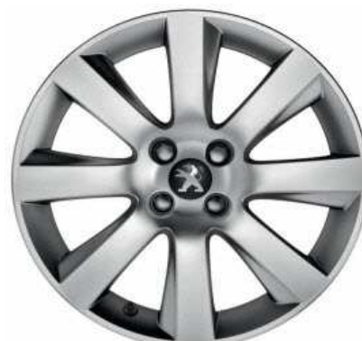
Jante alliage 18" IXION