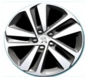
Jantes Alliage 17"