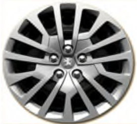
Enjoliveurs Full Cover 17"