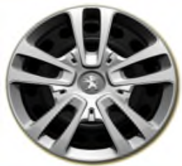
Enjoliveurs Full Cover 16"