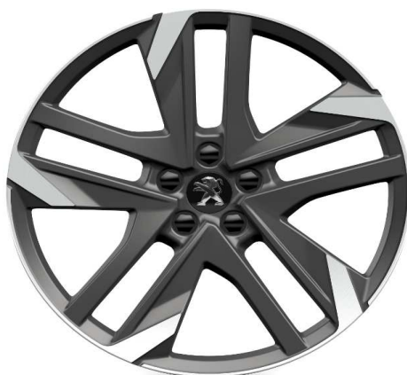
Jantes alliage 19" CARBONE19 (Chainables UNIQUEMENT avec chaînes POLAIRE Grip 70)