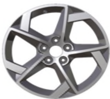
Jantes alliage 17" Style 11 Diamantée Gris Anthra