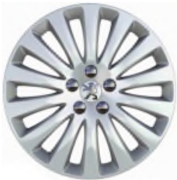
Enjoliveurs 16" Style A