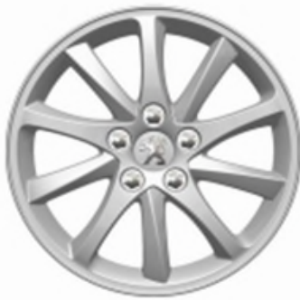
Jantes alliage 16" Style 01