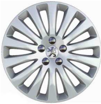
Enjoliveurs 16" Style A