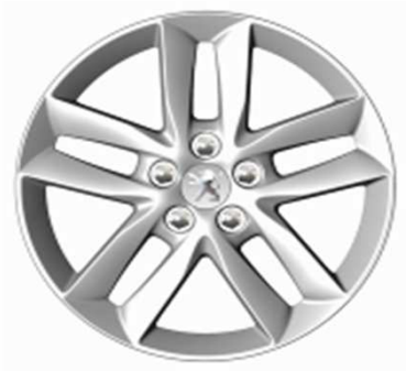
Jantes alliage 17" Style 04