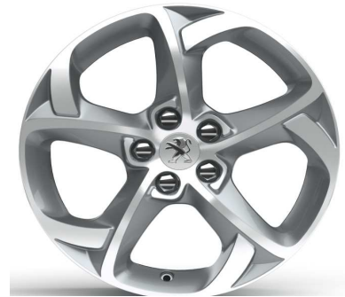
Jantes alliage 17" Style 06