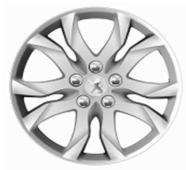
Jantes alliage 17" Style 05