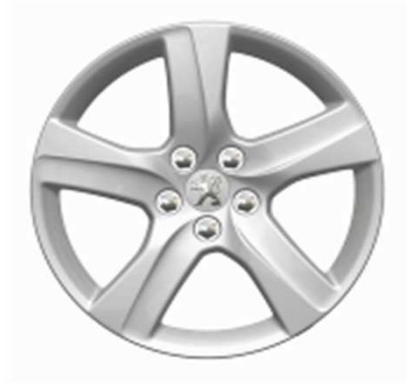
Jantes alliage 16" Style 02