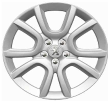
Jantes alliage 18" Style 07 Non chaînable