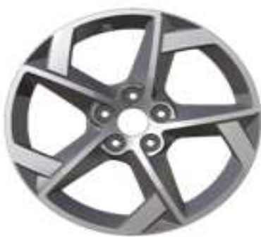
Jantes alliage 17" Style 11 Diamantée Gris Anthra