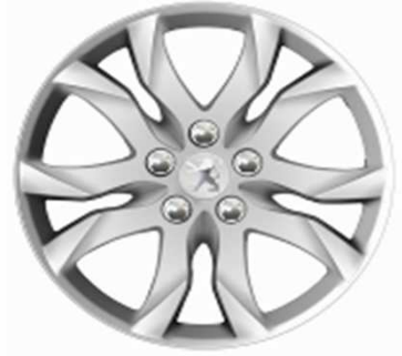
Jantes alliage 17" Style 05