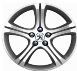
Jantes alliage 18" Diamantées Style 10 Non chaînable