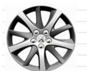
Jantes Aluminium 18" Diamantées Style 08

Les montes 18" et 19" sont non chaînables