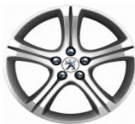
Jantes alliage 18" Diamantées Style 10 Non chaînable