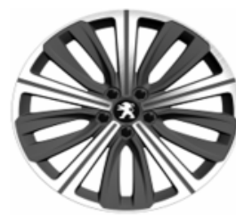
Jantes alliage 19" Diamantées Style 12 Non chaînable