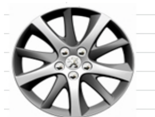
Jantes Aluminium 18" Diamantées Style 08

Les montes 18" et 19" sont non chaînables