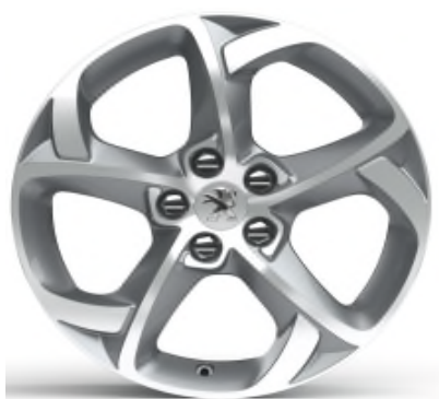
Jantes alliage 17" Style 06