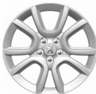
Jantes alliage 18" Style 07 Non chaînable