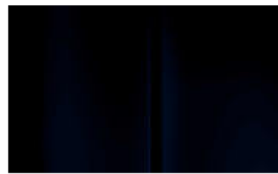
Réf. : COLOR_4PP0