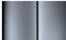
Réf. : COLOR_ZRM0