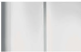
Réf. : COLOR_WPP0