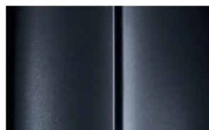
Réf. : COLOR_E9M0