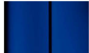
Réf. : COLOR_5VP0