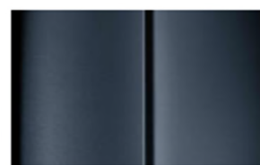
Réf. : COLOR_ZWM0