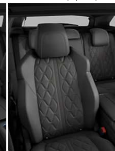
Cuir 'Nappa' Mistral