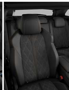
TEP & 'Alcantara' Mistral