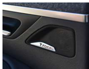
Système Hi-Fi Premium FOCAL®