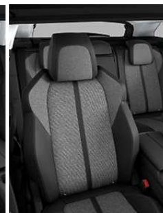
TEP & Tissu 'Piedimonte' Mistral