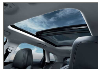
Toit ouvrant panoramique