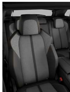
TEP & Tissu 'Imila' Mistral