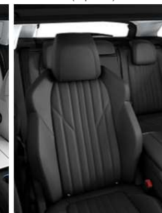
Cuir 'Claudia' Mistral