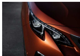
Peugeot Full LED Technology

(3) La présence de la roue de secours identique à la monte d'origine empêche de positionner le plancher de coffre en niveau bas