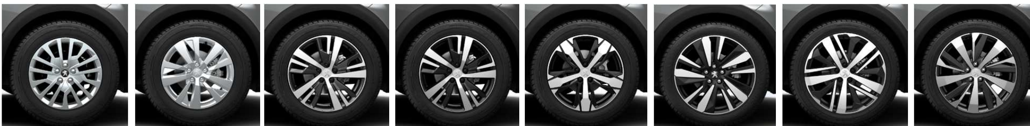
Enjoliveurs 17" 'Miami'

(3) Jantes 19" 'Washington' de série sur les motorisations basse consommation