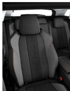
Tissu 'Meco' Mistral