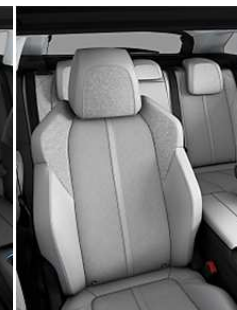
TEP & Tissu 'Evron' Guerande