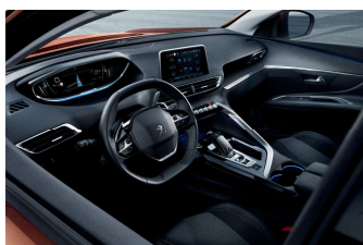
Nouveau Peugeot i-Cockpit®