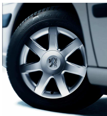
Jantes Alliage 16" Hadès et détecteurs de sous-gonflage