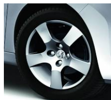
Jantes Canberra 16"