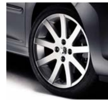
Jantes Pitlane 17"