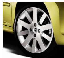
Jantes Hockenheim 17"