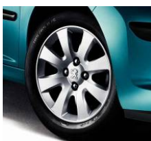
Enjoliveur Perth 16"