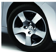
Jantes Canberra 16"