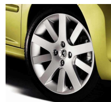
Jantes Hockenheim 17"