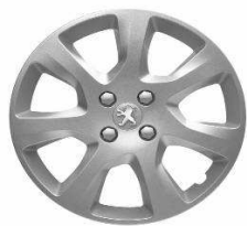
Enjoliveur ATAX 17"

Toutes les jantes de 3008 sont chaînables. Les jantes 17" et 18" sont chaînables avec jeux réduits.