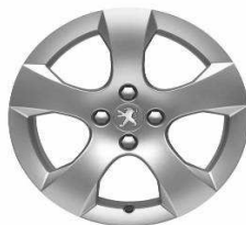
Jante alliage SAVARA 17"