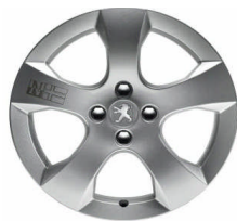
Jante alliage Spécifique 17" Logotypée NAPAPIJRI