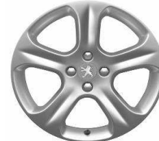
Jante alliage EXONA 18"