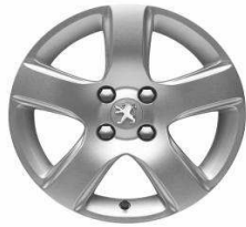
Jante alliage ISARA 16" (Uniquement avec option Grip Control)