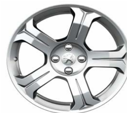
Jante alliage Lincancabur 18"