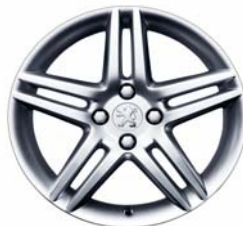
Jante alliage Stromboli 17"