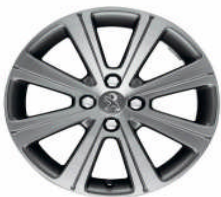
Jante alliage Melbourne 17"