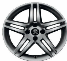
Jante alliage Stromboli Dark 17"