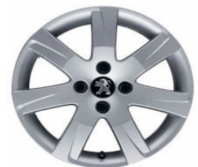
Jante alliage Santiaguito 2. 16"