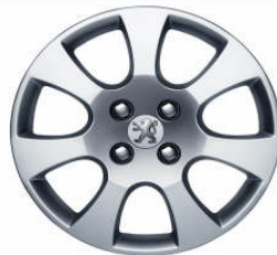
Enjoliveur Toliman 16"