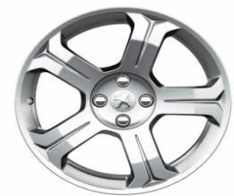
Jante alliage Licancabur 18"