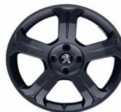
Jante alliage Licancabur 18" Dark Storm