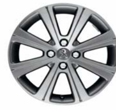
Jante alliage Melbourne 17"