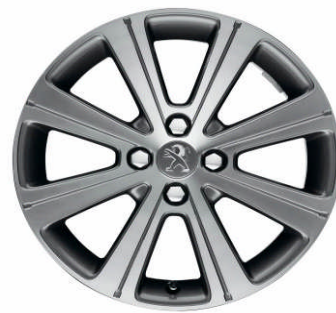
Jante alliage Melbourne 17"