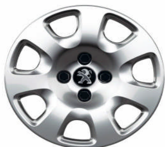
Enjoliveur Atacama 15"